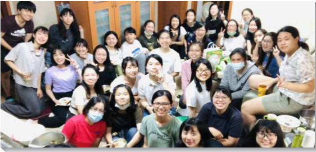
▲學生和聖徒們同心配搭開家福音

由於疫情的影響，這學期在校園傳福音遇到的阻礙比以往都更大，前段時間較難邀人到會所，再加上學校規定六十人以上的班級均改為線上課程，以致學生們幾乎無法在校園中接觸人。但在身體的交通中，眾人覺得需