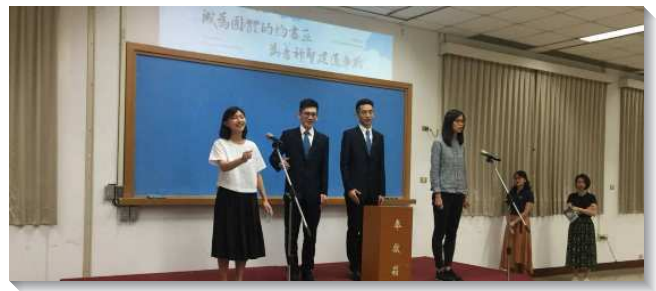
▲大學聖徒在呼召聚會中宣告參加全時間訓練

然而，為著爭戰的豫備與成全，必須出代價而有更深的奉獻。因此學員們展覽詩歌三五一首『奉獻一同主爭戰』。憑著我們自己，無法為神爭戰，然而基督已經得勝！現今祂只需要一班人高舉祂的名，高舉祂所已經成就的，在祂得勝的地位上與祂一同爭戰。有位已結訓多年暫時自國外返台的弟兄見證，這樣的訓練，奠定他往後生活事奉的態度與認定，不論在職或工作，都認識自己是個奉獻的人，樂意接受神所有的量給，並且無論身在世界何處，都堅定實行神命定之路，即使本次因疫情在台灣停留，仍奮力找出可牧養的對象。