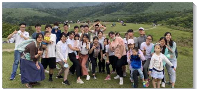
▲學生和聖徒們一同出外相調

藉著福家排區架構的實行，學生們不僅同配搭、同建造，召會的行動也成為他們的生活。願主祝福這群青年人，在年輕時裝備主話多面受成全，成為主合用的器皿，在召會中盡功用，建造基督的身體。（洪子涵）