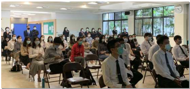
▲全時間訓練呼召聚會上場在三會所舉行

本次聚會主題為『成為團體的約書亞，為著神聖建造爭戰』。在啟示錄六章我們看見四匹馬的奔跑，揭示在末了的時期必滿了戰爭、饑荒、死亡的光景，為應付主時代的需要，必須有一班受成全、被豫備的青年人，成為團體的約書亞，為神的權益爭戰。為此盼望藉著訓練，使更多向主有心的青年人在真理、事奉、生命、性格、心志等八方面有所裝備，成為基督身體上活而盡功用的肢體，並被作成神團體的戰士，為神聖建造爭戰。