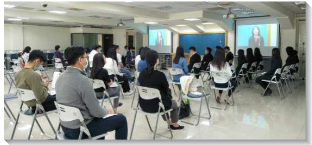
▲全時間訓練呼召聚會分場地舉行

有心為著神，乃是主對我們極深的憐恤，然而，還需要主進一步的製作，使我們能合乎主用。接著有另外六位學員，見證在訓練中的蒙恩，他們如何在生命、性格、真理、職事、事奉與心志上，受主成全。因著生命的長大與性格的操練，使學員們成為一個正確的人，加上真理與事奉的裝備，使他們有豐富的供備與實行神命