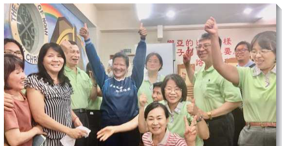
▲壯年班學員在屏東恆春帶人受浸得救

中彰投共有四個開展隊，一週共結了四十一個果子。台中第一及十八大區開展隊在當地聖徒的扶持下，靈裏火熱，一同為福音竭力奮鬥。彰化溪州隊與彰化縣眾召會聖徒與壯年班畢業學員，編組成爲基督精兵，一週得了十五個果子。南投竹山隊則在竹山及鹿谷兩個鄉鎮開展，在鄰近召會（南投、草屯、芬園、埔里）聖徒們的配搭下，經歷基督身體的實際，受浸了十五位新人。