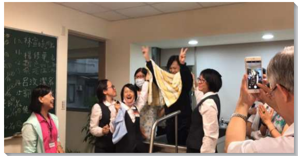
▲聖徒們和學員們同心配搭帶人受浸得救

週四中午有職場排，聖徒邀請公司的同仁共九位福音朋友，在學員的見證及詩歌中，真理的種子撒進他們心田，連公司總監都覺得太有福了。週六福音聚會，聖徒們竭力邀約親朋好友與會。姊妹們在外面傳完福音後，就相約去密室禱告，經歷被聖靈充溢而流淚，裏面滿有把握必定有人受浸。福音聚會後，一位在信仰上無法突破的朋友，在姊妹們的迫切下，喜樂的受浸得救，應驗了樓房上的禱告。今年本會所配搭叩訪人位從去年的二十七人增為三十人，受浸人位也增多。讚美主，我們在身體裏同心合意就能得勝結果子。（陳中偉）