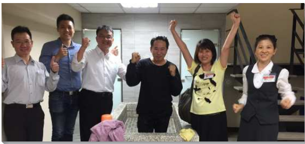
▲壯年班學員在台北六十九會所帶人受浸

出發前，各組學員和輔訓們不斷為開展禱告與交通。經過將近三個月的豫備，在行前誓師大會上，學員們士氣高昂、靈裏焚燒，願意奉差遣往全台宣揚國度的福音。服事者在行前交通中，期勉學員們『多結果子』。一、要多祈求，要有託負（路十2）；二、務要同心，彼此建造（腓二2）；第三、要有負擔，要求祝福（約十五16）；四、要憑靈而活，憑靈而行（加二20）。