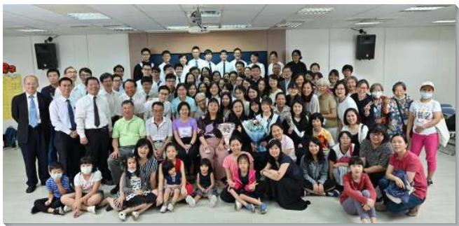
▲聖徒們和學生們同過召會生活

四十二會所聖徒於六月十四日有集中主日暨政大畢業生聚會，共有一百多人參加。雖稍受疫情影響，聖徒們仍家家帶菜愛筵，熱切交通。有畢業生見證，在召會中受培育，盼望參訓後回來服事校園。是主的恩典使聖徒們長年來配搭政大校園的開展，今年學生校園福音則由學生作。社區聖徒及學生們同心配搭，社區的家為學生打開，學生們有屬靈父母，也在召會中受成全，服事聖徒家中的兒童及青少年。