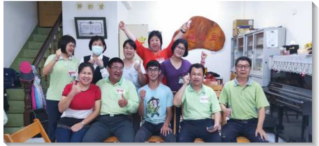
▲壯年班學員在南投竹山帶人得救

新竹開展隊分別在新竹市八大組及竹東鎮開展，一週兩隊受浸四十人，遠遠超過宣告人數。本次開展最可貴