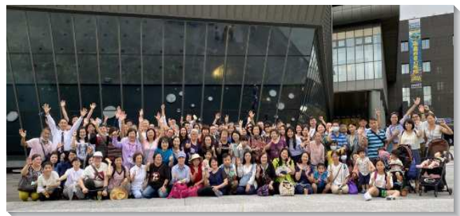
▲聖徒們竭力過召會生活

讚美主，基督是我們的生命，召會是我們的生活。這樣的線上禱告讀經，使我們天天操練成為有活力的基督徒，也成為建造召會的活石。（許永漂）