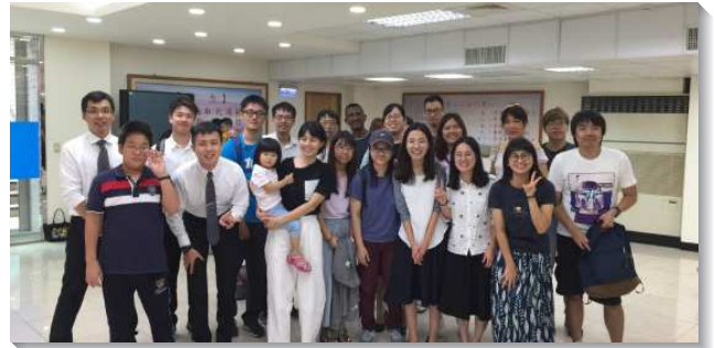
▲聖徒們同心過召會生活

聖徒們不因外面的環境而停留不前，透過線上聚會及送會到家，擴大了我們接觸人的範圍，將許多原先未聚會的聖徒及福音朋友恢復並聯於召會生活。弟兄們鼓勵我們要更進一步將人從線上恢復到現場聚會，好能更實際的有分召會生活，人人盡生機的功用。（洪義翔）