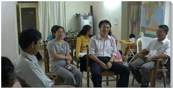
▲印度古爾岡召會新人成全聚會

從『冰天雪地』到『水深火熱』一在二〇〇五年以前，關於海外開展的需要與蒙恩見證，多是與俄國有關，因此那時我就豫備好，將來會到『冰天雪地』的地方開展。然而，當報名表送出後，弟兄們決定打發我們到印度。在當時幾乎沒有關於印度開展的交通，因此對印度的印象只有：古老神祕的國度、髒亂、瘧疾、炎熱…等。一時之間，我還無法反應過來，只覺得從『冰天雪地』瞬間掉到了『水深火熱』之中。我雖然沒有說出口，然而裏面卻充滿疑惑，不斷反覆的問主，為什麼是『印度』？