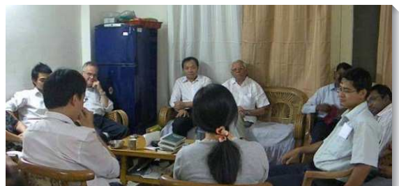
▲印度古爾岡召會服事者交通

禱告完後，遠方的月台上，突然出現一位印度人，他指向前方的計程車，要我上車。上了車後，因無法溝通，也不知道車要開往何處，只能不住的禱告。下了車後，看見眼前有幾輛公車，卻不知該搭乘那一輛，只能在禱告中選擇。上了公車後，仍然不知道公車將要開往何方，只有在禱告中不斷仰望。公車不知行駛了多久，最後抵達了一個大站。我在那裏下了車，沒有想到，第一眼看見的便是一位親愛的弟兄，他還在那裏等待著我，此時我的眼淚奪眶而出，我向主說，『主啊，你是我活的地圖，無論到何處，我要將我的愛情給你』。