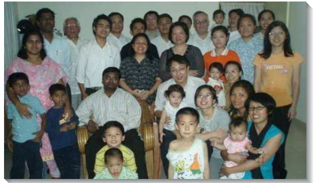
▲印度古爾岡召會聖徒與台灣聖徒合影

在『那裡』把我的愛情給主一我帶著這樣的疑惑到美國參加夏季訓練，那年的夏季結晶讀經交通到『帖撒羅尼迦前後書和雅歌七、八章』。到了最後一篇信息，RON弟兄交通到，當我們在生命、性情、功用和彰顯上與基督一模一樣，我們就殼資格與祂同工，同往田間去，同在村莊住宿，就是從一地到另一地寄居，顧到祂在全世界的工作，看看葡萄發芽開花了沒有，石榴放蕊了沒有，並且在『那裏』把我們的愛情給主！當RON弟兄問到，弟兄姊妹，『你的那裏是哪裏？』這好像是主親自對我說話。事實上，我的『那裏』主早就已經告訴我了，我的『那裏』就是『印度』。當下我裏頭豁然開朗，也清楚主呼召我就是要去印度。隔天主日，弟兄們希望我在喜瑞都召會鳥瞰最後三篇信息，鳥瞰信息後，我向弟兄姊妹宣告：『弟兄姊妹，我清楚了，我知道我的『那裏』是哪裏，我的『那裏』就是印度。我要在『那裏—印度』把我的愛情給主！』