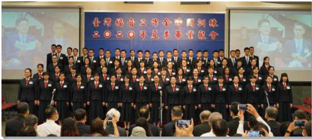
▲全時間訓練畢業聚會在信基大樓舉行

本次畢業聚會的主題為『極美之地』。本期學員們根據共同經歷，創作了兩首畢業詩歌。第一首是『極美之地』，描繪他們對主作美地的經歷。從小麥到大麥，葡萄樹、無花果樹，石榴樹和橄欖樹共六項作物。帶我們經歷祂的死與復活，犧牲卻喜樂滿足，並看見祂的美麗及被靈充滿而有正確的事奉。第二首『同主爭戰』則說出學員們絕對跟隨主的心志。在訓練中藉著認識職事，看見神在今時代所要作的乃是建造基督生機的身體。為此，便答應神的呼召，進入加略聖軍，憑著那靈對付肉體，並藉著在升天裏的禱告捆綁仇敵，將福音傳遍居人