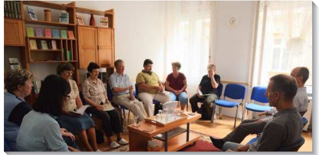
▲在匈牙利的聖徒們於禱告聚會中交通禱告

成水流職事站的辦公室，弟兄們也同意了。主祝福祂在那地的工作，以不到台幣一百萬元，買到位於布達佩斯市中心重新裝潢在二樓的公寓，空間寬敞，傢俱適用，不僅成為辦公室，出版許多職事的書報，現今也作為會所，接待各國的聖徒。我們離開後陸續有聖徒來此配搭，目前有一對美國夫婦和一位當地聖徒在那裏全時間服事主。