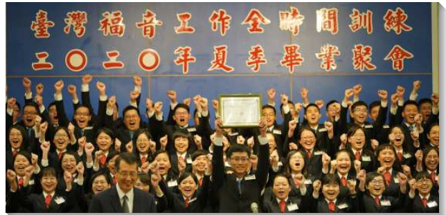
▲全時間訓練畢業學員獲頒畢業證書

職事一面，一位弟兄見證，如同舊約的君王抄錄律法書並終生誦讀，受其管制支配。今天我們從新約中，認識使徒的教訓作為生活和工作的準則，好執行基督以建造召會作基督的身體。真理一面，一位弟兄原先在召會生活中有美好的配搭，卻未看見他的生活和工作該以新耶路撒冷為目標，不僅要勝過消極的事物，更該勝過頂替新耶路撒冷的積極事物。生命一面，一位姊妹從訓練課程中，看見所有的罪都與『自己』有關；所有美德都與『脫離自己』有關。當她順服訓練的帶領，學習接受基督無己、犧牲的生命時，就使神、人喜樂。性格一