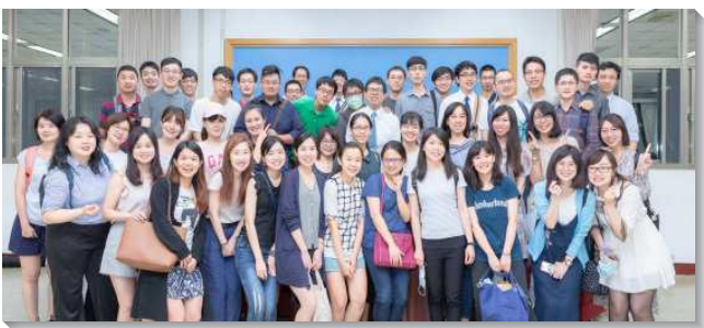
▲大安區青職聖徒參加相調成全聚會

本次聚會先有愛筵交通，為此，大安區九個會所的青職聖徒們彼此邀約一起配搭做菜或帶菜，大家享用豐盛的佳餚，亦分享召會生活的蒙恩，眾人都滿有參與感。