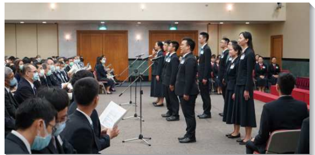
▲全時間訓練畢業學員分享見證

事奉一面，一位姊妹在西螺開展時，看見召會逐漸老化，在靈裏面興起了得青年人的託付，甚至為此禁食，就經歷基督如大麥的復活生命，將一個個青年人和年輕的家帶進召會裏。基督身體一面，一位弟兄已過在服事中會遷就人、維持和諧，以為這是否認己順服帶領。訓練幫助他認識身體的一是那靈的一。當他在無法順服時，就在靈裏取用基督的死與復活，使他能活在身體的實際裏面。在心志一面，一位姊妹見證，在取得博士學位後，雖帶著負擔參加訓練，卻仍心繫學術夢。藉著職事的開啟，看見當前的時局，主需要一班轉移時代的人，這使她樂意奉獻夢想及前途，只為完成神的經綸。