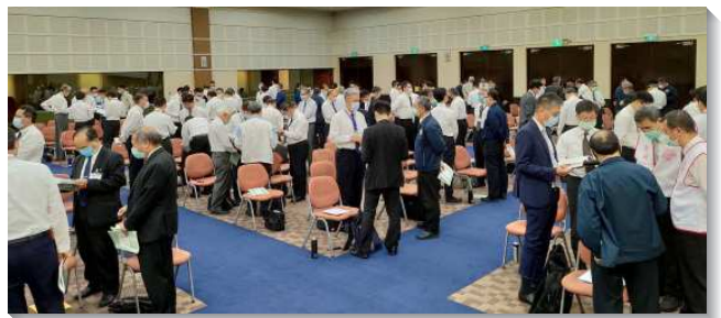
▲聖徒們分組禱研背講信息

本次訓練共十二篇信息，涵括了整本耶利米書的主要內容：神藉著在愛裏，帶著祂柔細的關切、憐恤和同情，對祂選民以色列的懲治，以及在與祂的愛相配的義裏，對列國的審判，來完成祂的經綸，好叫以色列藉著成為新造，有神聖生命內裏的律，並這生命所具備那認識神的性能，而彰顯基督；基督就是他們神聖的義，作他們的中心和圓周。