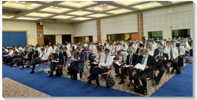
▲聖徒們進入夏季訓練結晶讀經信息

神是永遠且不能改變的，祂不因任何環境和情況而有任何改變，並且神的寶座乃是祂永遠不變之行政的寶座；在說到神永遠的所是和祂的寶座時，耶利米從自己屬人的感覺裏出來，摸著神的身位和神的寶座，並進到神的神性裏。神是我們的窯匠，照著祂的豫定，主宰的將我們造成祂的器皿（祂的容器）以盛裝祂自己；神造人的目的是要將人作成祂的器皿，祂的陶土容器，為要盛裝基督作生命並被祂充滿，好建造基督的身體，作神極大的團體器皿，使祂得著彰顯。