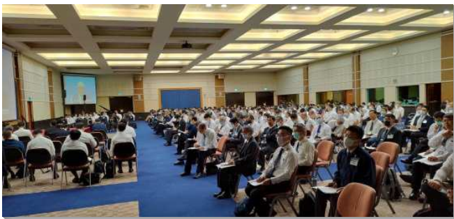
▲上半年夏季訓練聚會在中部相調中心舉行

本次結晶讀經訓練的標語－關鍵陳述（key statements）如下：『耶和華是心裏柔細的神；在心裏柔細這點上，耶利米與神完全是一；因此，神能使用申言者耶利米這位得勝者來彰顯祂，為祂說話，並特別在他的哭泣上代表祂。耶利米書滿了關於以色列的罪，