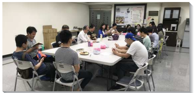
▲聖徒們邀約朋友至會所參加福音小排

二、福音收網的實行：每個月有一次全會所的福音收網聚會，其餘各週主日晚上均有小型的福音聚集。藉著晚餐愛筵及唱詩歌、分享見證，與會的聖徒及福音朋友均十分享受。參加的人數由一年前初期約十人以下，繁增到目前每週平均約有二十人與會，其中包含福音朋友平均約二至三位，主日未能參加聚會的聖徒五至六位。