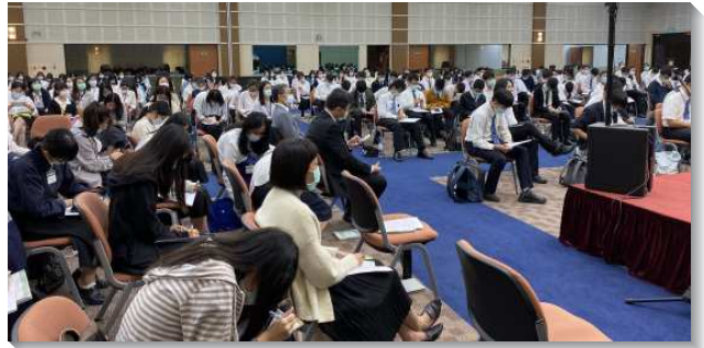
▲大學聖徒專注進入夏季現場訓練信息

事的話語構成。其中一堂安排學生們以大區分組研討，弟兄們提供綱目上所根據的經節、註解以及職事信息，分配段落讓學生自行研讀。過程中弟兄姊妹們逐步整理出綱目思路、彼此對說，深入信息的負擔。