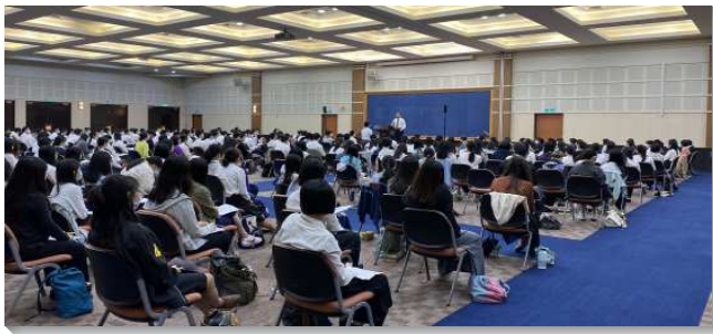
▲大學聖徒夏季現場訓練於中部相調中心舉行

在第一篇信息中，說到耶利米這位心裏柔細的申言者。弟兄以耶利米的蒙召鼓勵大學生，不要覺得自己是年幼的，因為神會裝備我們，使我們成為堅城、鐵柱、銅牆，作與這世代相反的見證。第四篇說到神的話是神聖的供應，作食物滋養我們。耶利米在非常令人灰心的光景中，竟能說出『你的言語成了我心中的歡喜快樂』。我們的情緒若時常高低起伏，是因為神的話在我們裏面構成得不穀。弟兄以倪柝聲弟兄為榜樣，他雖然被囚在獄中仍維持靈裏的喜樂，鼓勵我們作出代價裝備主話的人，使主的話成為我們心中的喜樂。弟兄姊妹之家要給人一個印象一人人都在喫神的話。學生們受激勵要奉獻暑假與新學期的時間，認真讀經、追求書報，享受神的話作食物。