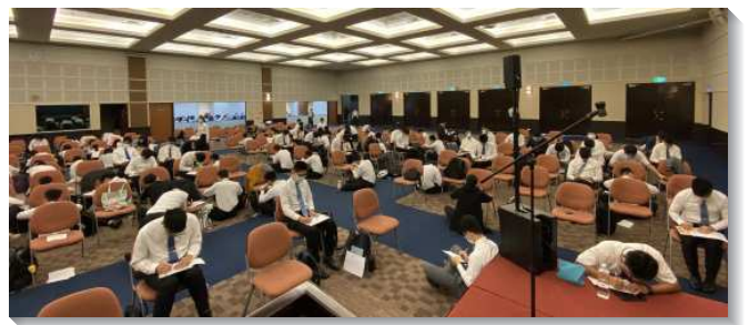
▲學生們在會場認真背誦經節，書寫考卷

訓練亦安排默經進度以及考試，鼓勵學生背誦耶利米書與耶利米哀歌中的重點經節。弟兄姊妹們利用下課時間、排隊打菜以及寢室晚禱，三三兩兩來在一起禱讀背誦。休息時間減少了閒談，取而代之的是彼此對說重點經節，而贖回光陰。有些學生受到激勵，一同認真準備，使訓練中滿了背誦經節的空氣。考試時學生出席的十分踴躍，一起在會場書寫考卷。最終有兩位學生得到滿分，九十分以上有二十位。