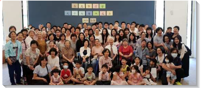
▲七十七會所於五月三十一日成立

今年初，我們在十會所和六十七會所的聯合展望交通中，盼望於五月三十一日增出七十七會所。然而從二月開始，因疫情的影響，使各種聚會的人數受到限制，聖徒們對於增會所的實行不免有些猶疑。但是為著如期增出七十七會所，負責弟兄們率先編組，與各小區多有交通，顧到每個小區聖徒們的感覺，並召聚豫定增至新會所的弟兄們有外出相調交通，好使增會所的負擔達到一致，並使增會所的負擔在眾聖徒裏面持續焚燒。