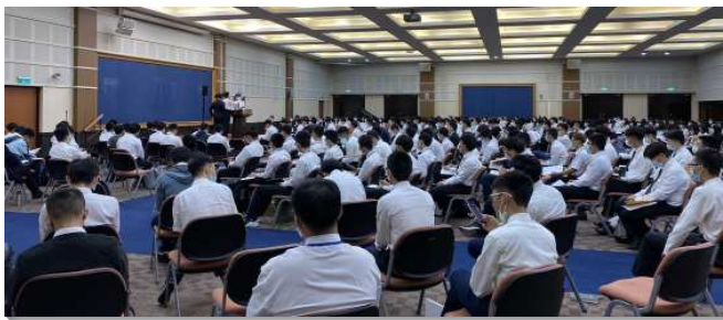
▲大學新生聖徒成全訓練於中部相調中心舉行

在第一天晚上的開訓交通中，弟兄們帶領大一新生和陪伴服事者向主倒空並且有更新的奉獻。在開訓交通中，弟兄提到在此次的成全訓練裏需要有三方面的操練：（一）向著神，要操練在主面前；（二）向著人，要盡功用、造就人；（三）向著自己，要作敞開的器皿，接受豐盛的恩典。