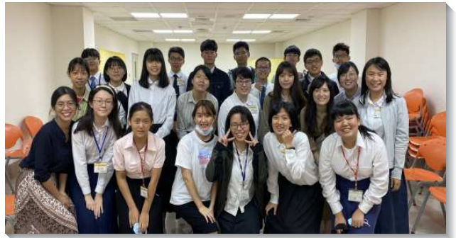
▲大學服事者陪伴新生聖徒參加訓練

成全訓練的課程兼顧弟兄姊妹個人以及團體的需要。在個人一面的負擔是：盼望每一位新生都成為活的器皿，愛主勝過一切。在『靈的操練與認識』上給學生看見，我們必須在為人、生活、行事，並在一切事上都操練我們的靈。『晨興、午間系列』幫助學生建立個人與主情深的生活，並且與主同工配合主的心意。『舊約人物榜樣系列』，乃是以舊約中但以理、以斯拉、尼希米、以斯帖為榜樣，盼望學生們看見這些鮮活的異象，並推動他們更有操練。在團體一面的負擔是：實行身體生活帶進召會的復興。課程有『入