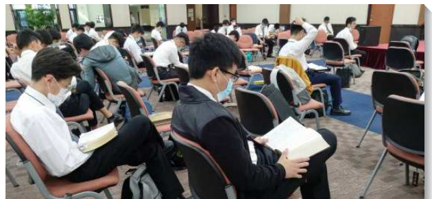
▲學生們在會場認真研讀聖經

大學陪伴者在陪同的過程中，看見新生們一個個的過關並突破時，非常受感動。有位陪伴者在訓練中，陪著新生們操練靈，並率先做榜樣，她裏面的人也被激動起來，使她向主有更新的奉獻！而主也向她說