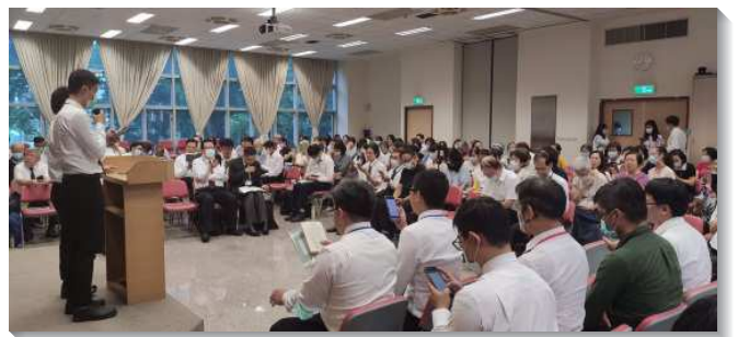
▲城中大同區夏季現場訓練場地之一——四會所

三個場地亦安排在聚會期間，展覽召會生活蒙恩。如二會所場，第一天晚上的聚會中段，有從該區域報名之全時間訓練學員展覽訓練的蒙恩，藉此機會呼召有心事奉的青年人，抓住機會奉獻自己參加全時間訓練。也使多年來在召會中看這些弟兄姊妹長大的聖徒們，心得安慰。最後一日在三個場地，不僅有兩場的兒童展覽，也有全時間學員在休訓期間聯合開展的分享。藉這些展覽與蒙恩見證，弟兄姊妹在身體交通中也與他們一同蒙恩。願主藉祂時代的說話，在城中大同區尋得更多像耶利米一般剛強、奉獻、愛主的聖徒們，如同堅城、鐵柱、銅牆，為主站住。 (黃俊達、藍瑜、賴彥嘉)