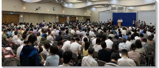
▲信基區夏季現場訓練在信基大樓地下二樓舉行

訓練裏各專項都顯出蒙恩的情形：青職弟兄們藉著配搭每堂聚會的領詩以及末了信息加強，在話語和靈上受操練。大學生於大學現場訓練結束後，從中部相調中心趕回台北，繼續參加大區現場訓練，渴慕被主的話浸透。青少年不僅坐在台下參加，也操練上台分享。兒童