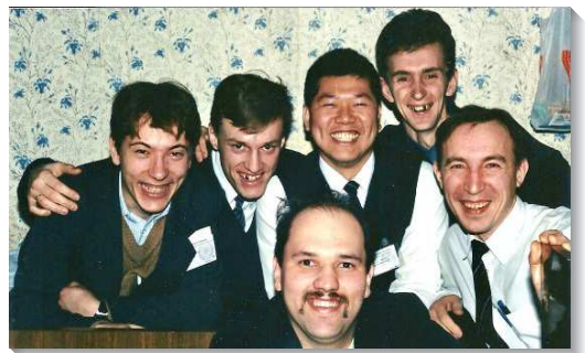
▲ 聖徒們至莫斯科參加兩週訓練

基市，除了顧及當地的需要，我們也必須拜訪鄰近約二十處城鎮的尋求者，有的車程長達十八個小時。途中望著窗外經過的城鎮、村莊、田野，腦海常常浮現雅歌七章十一至十三節，這幾節也成了我向主的禱告：『我的良人，來罷，你我可以出到田間；你我可以到村莊住宿。我們清晨起來往葡萄園去，看看葡萄發芽開花沒有，石榴放蕊沒有；我在那裏要將我的愛情給你。風茄放香，在我們的門口有各樣新陳佳美的果子。我的良人，這些都是我為你存留的。』感謝主！我們能穀經歷在愛裏與主同工。到了各地均看見許多美好的見證，例如一位年長姊妹不僅讀過『神新約的經綸』十遍以上，甚至都禱讀過，也邀約尋求者同讀。一位弟兄說，有次他從中午禱讀書報『使徒的教訓』直到下班，全人被主充滿。另一次我們彼此分享書報『今時代神聖啟示的先見』，其享受猶如在三層天上。另一位弟兄發電報來說，他們要再開始第三遍追求創世記生命讀經（共一百二十篇），希望我們去拜訪，幫助他們深入其中，可見到處都有飢渴尋求真理的聖徒。