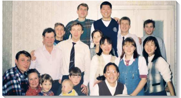
▲ 聖徒們在一個新人裏相調

基市，除了顧及當地的需要，我們也必須拜訪鄰近約二十處城鎮的尋求者，有的車程長達十八個小時。途中望著窗外經過的城鎮、村莊、田野，腦海常常浮現雅歌七章十一至十三節，這幾節也成了我向主的禱告：『我的良人，來罷，你我可以出到田間；你我可以到村莊住宿。我們清晨起來往葡萄園去，看看葡萄發芽開花沒有，石榴放蕊沒有；我在那裏要將我的愛情給你。風茄放香，在我們的門口有各樣新陳佳美的果子。我的良人，這些都是我為你存留的。』感謝主！我們能穀經歷在愛裏與主同工。到了各地均看見許多美好的見證，例如一位年長姊妹不僅讀過『神新約的經綸』十遍以上，甚至都禱讀過，也邀約尋求者同讀。一位弟兄說，有次他從中午禱讀書報『使徒的教訓』直到下班，全人被主充滿。另一次我們彼此分享書報『今時代神聖啟示的先見』，其享受猶如在三層天上。另一位弟兄發電報來說，他們要再開始第三遍追求創世記生命讀經（共一百二十篇），希望我們去拜訪，幫助他們深入其中，可見到處都有飢渴尋求真理的聖徒。