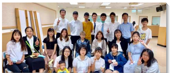
▲青年人參加暑假特會

啟示錄六章二節說：『我就觀看，看哪，有一匹白馬，騎在馬上的拿著弓，並有冠冕賜給他，他便出去，勝了又要勝。』主在這段期間，帶我們經歷：祂是勝了又要勝的一位。我們深信，因著享受主話，與主配合，並出去傳揚福音、湧流生命，祂必要照祂的話，將得救的人天天加給祂的召會，不僅我們自己在這道聖靈的水流裏，也要帶更多的人進入這流中。（王佳美）