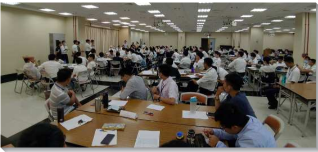
▲北投大區暑期青少年特會在六十會所舉行

特會也專特幫助學生們認識以西結書中，風、雲、火、金的經歷，藉由問答使青少年明白屬靈的豫表及意義，藉著唱詩歌挑旺靈，眾人經歷聖靈大風的吹、雲的覆蓋。在分享中許多青少年對自己現狀不滿意，因而有宣告並向主奉獻，求主的烈火焚燒與煉淨，留下精金，人人都成為貴重的器皿，合乎主的使用！（甘順基）