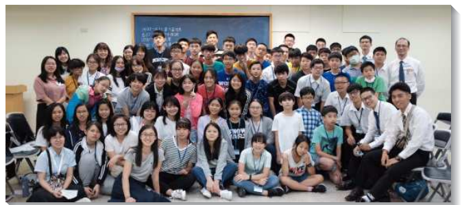
▲信基大區暑期青少年特會在三會所舉行

文山二、三大區的特會，於七月十七至十九日在台北二十九會所舉行，共有三百五十人參加。主題為『主的再來』，第一堂的詩歌就使學生摸著特會的負擔：要與同伴彼此激勵，脫離世界的吸引，認識這世界快要過去。藉著詩歌和信息，學生們受題醒不該再留戀世界的娛樂，必須要從其中分別出來。信息帶領學生們認識為