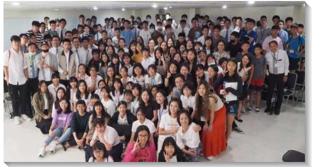
▲士林、大安區暑期青少年特會

大安、士林兩個大區的特會，於七月十五至十七日在龍潭渴望會館舉行，共有一百一十九位青少年和五十五位服事者參加。特會的主題是：『一個有時代價值的人』。信息以但以理的人物為榜樣，論及主的再來與新