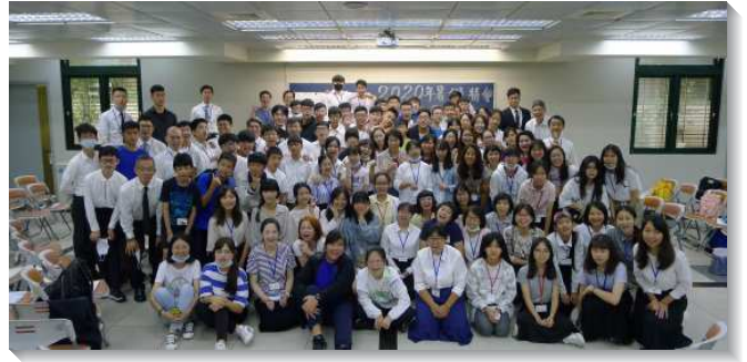
▲港湖大區暑期青少年特會在忠義會所舉行

這次特會並有青少年暑假共同追求『轉移時代的人』一書的展覽。青少年分享，願意做自願奉獻的人，以但