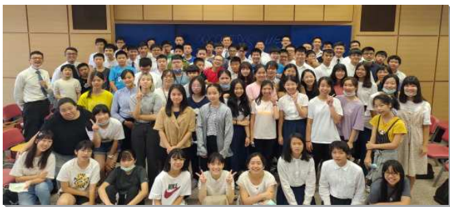
▲城中、大同區暑期青少年特會在四會所舉行

信基大區的特會，在七月十四至十六日於三會所舉行，共有七十二位青少年和二十七位服事者參加。這次特會信息為『新婦的豫備』，目的是要使學生們的眼睛得著開啟，看見世界局勢的發展是為著主的恢復的開展，為著豫備新婦、為著金燈臺在許多國家興起並照耀。且認識為著主的恢復，主所給我們終極的責任是什麼。盼望學生們能毅立定心志，作神時代的憑