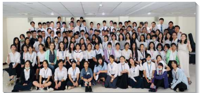
▲文山一大區暑期青少年特會

特會的總題為『得勝的生活』，盼望青少年弟兄姊妹們，在新學期開始之際，更新奉獻，心中定大志、設大謀，過一個從世界分別出來，並勝過罪、世界及肉體的得勝的生活。這次共安排三堂的信息及一篇專題。第一篇信息為『基督徒在地上生活的異象』，看見異象的原則就在於『需要有心』、『需要放下』、『需要等候』、『需要清心』、『需要敞開一心轉向主』。第二篇信息以『為主惜取少年時』，開啟青少年們，應在愛神、受教育、性格等三方面，好好裝備自己。