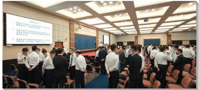
▲聖徒們在聚會中一同團體禱告

第三篇信息『為著神當前並終極的行動，四活物之配搭與行動』。以西結書一章九節和十一節下半至十二節，陳明一幅我們在召會生活中所需要之配搭的美麗圖畫。無論活物往那個方向行動，任何一個都不需要轉身，一個只要直往前行，一個倒退，往後行動，另外兩個旁行。在召會的事奉中，我們每一個人不但要學習如何往前行，也要學習如何退行並旁行。退行和旁行就是對別人的職事、功用和負擔說『阿們』，直往前行的人有責任隨從靈。活物隨從靈（結一20），指明我們要在基督的身體裏與人配搭，就需要憑著靈而行。在召會裏事奉，就是為著基督身體的建