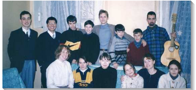
▲聖徒們參加青少年聚會

每週五我們都邀請弟兄們到家裏愛筵，追求信息。常有弟兄提早抵達，想要和我有個人、敞開的交通。聚集完，大家不顧回家路途遙遠，送到了門口，還要交通半