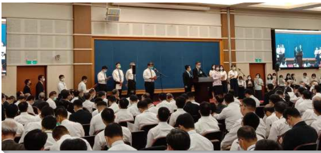
▲全台同工秋季成全在中部相調中心舉行

第二篇信息為『藉著禱告來事奉並移民開展』。在使徒行傳中我們看見早期頭一班基督徒乃是藉著禱告來事奉主。我們若查讀這一切聖經節內容，禱讀這些聖經節，就會看見在每個事例中，這些不同的事奉者，都只採取一條路，就是禱告的路。他們所作的每一分服事，為主所作的每一點工，都是由禱告發起的。在主恢復移民開展的行動中，必須是一件在靈裏的事。惟一能使我們清楚這一切實行的路，乃是藉著禱告，不是藉著組織，或藉著人為指派的路。