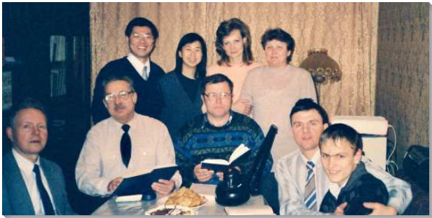
▲聖徒們追求真理，一位青少年受浸（右一）

聖徒們愛主，熱切追求真理，渴慕聚會。一次主日會後有位弟兄在書報處躊躇許久，至終他用要買地鐵票的錢，買下晨興聖言，然後走路兩小時回家。另一次寒流來襲，主日早晨是零下27°C，原以為今天許多聖徒可能無法前來，沒想到會所充滿了人。外面的寒冷完全無法阻擋聖徒對主日聚會的渴慕，而且個個釋放靈禱告、讚美主，申言內容豐富，至今仍印象深刻。禱告聚會多是三、五句的簡短禱告，彼此相接，眾人禱告如同一人，新鮮又有衝擊力。