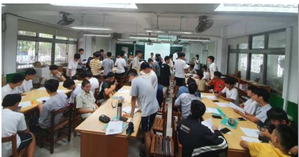
▲學生們踴躍參加校園排

社團擺攤、在校門口操練傳講『人生的奧秘』，將人帶到福音餐廳享受愛筵與詩歌。每學期在社團聯展向全校同學唱詩歌、傳福音，帶全場同學開口呼求主名，並邀約同學們參加聚會。開學後，弟兄們除了每週一、五放學在學校側門操練接觸生門外，每週四的中午校園排，更是大量邀約熱門同學，往往人數都會超過五十位。福音朋友如同要踏破教室門口般的湧進來參加，高聲呼求主名、大聲唱詩歌。許多福音朋友除了自己來參加外，還把班上、社團的同學一群群的邀來。在九月二十四日的校園排就來了九十多人。『聖經真理研究社』，成為建中學生在高中生活的回憶裏不會褪色的光明雲彩。