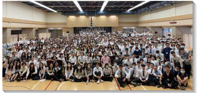
▲大學秋季期初特會在林口舉行

學生們也因耶利米書一章七至八節的話受鼓勵，這段經文說：『耶和華對我說，你不要說我是年幼的；因為我差遣你到誰那裏去，你都要去；我吩咐你說甚麼話，你都要說。你不要懼怕他們的面，因為我與你同在，要拯救你；這是耶和華說的。』主的話使我們不小看自己的年幼，更不因年紀尚輕而覺得不能作什麼。傳福音不只是高年級或研究所的弟兄姊妹才能作的事，每個被主呼召的人，不論光景如何，只要簡單