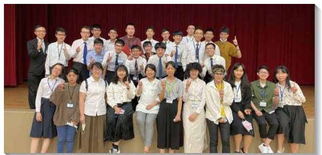
▲學生們宣告過福音的生活，作基督的見證人

在特會的末了，也帶進團體奉獻的水流。學生們以個人、活力組或校園為單位，將新的學期以及整個求學的階段再奉獻給主，願意在真理的追求、生命經歷和實行神命定之路上，受多面的裝備和成全。並且在末了宣告聚會中，學生們在主面前尋求負擔和目標，