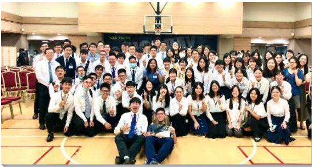
▲學生們參加大學秋季期初特會

在特會信息第四篇中『國度的子民傳揚國度的福音並牧養羊群』，說到馬太福音二十四章十四節：『這國度的福音要傳遍天下，對萬民作見證，然後末期才來到。』弟兄們在會中呼籲：『若是主耶穌遲遲還不回來，我們大家都有責任，因為我們沒有將這國度的福音傳遍天下！』這一段話深深的扎在學生們的心上！大多數的學生都很有心願要迎接基督的再來，然而卻蒙光照，在生活中仍缺少實際的行動，並未將國度的福音傳遍天下。