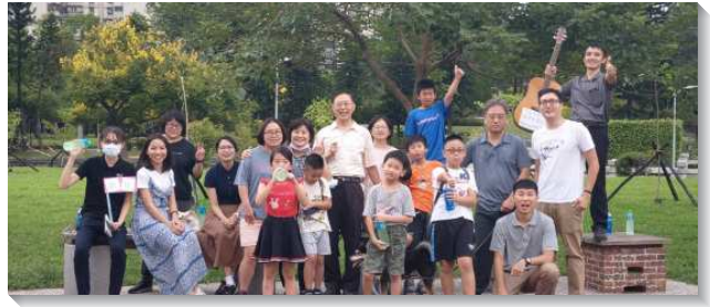
▲聖徒們與兒童至公園傳福音

長們會彼此配搭、互相扶持。當某位家長有事無法配搭時，其他家長都會主動協助。主日下午結束後，各家親子們也會彼此相約外出相調，顯出召會生活的實際。