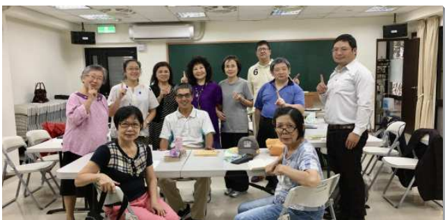
▲聖徒們週週歡聚職場排

溫暖。在弟兄吉他伴奏中，靈中有如插翅上高空，會中也追求初信成全信息。不久，有位劇團的朋友得救了，久不聚會被恢復，其他團體的聖徒穩定的跟我們調在一起，也不時有朋友進到會中來，滿得主生產乳養之福。