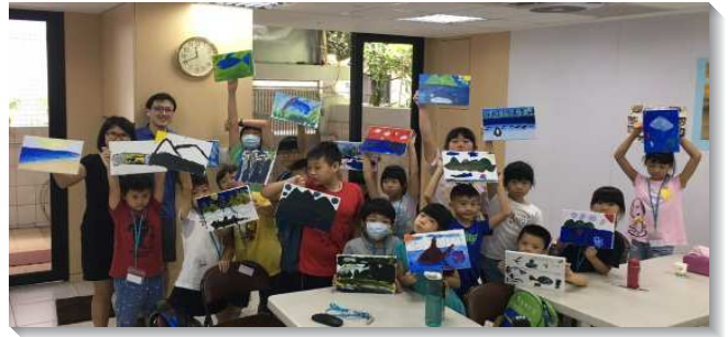
▲聖徒陪伴兒童們參加生命成長園

在成長園的規畫一面，我們豫備性格故事—親、熱、就，帶兒童們從聖經的話、人物的榜樣學習正確的性格，並藉著唱詩歌和禱告，讓孩子們接觸神。許多孩子雖是第一次參加，但他們的心向著神真是單純。在一次次唱詩、禱告之中，有的從暴躁中安靜下來，有的從緊張張到喜樂開懷。有的兒童喜歡唱詩歌，不僅上課時背起來，回家後還向奶奶詢問如何能從網路上找到所學的兒