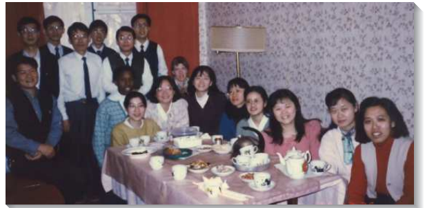
▲在莫斯科開展的聖徒相調

當時赴俄開展的報名有幾項條件：一、必須參加過全時間訓練。二、必須有一生事奉主的心志。三、單身或已婚但短期（一年）內不打算有孩子。四、參加英文測試。對我而言，全時間訓練已參加過，有一生事奉主的心志，當時單身。前三項不是問題，較為難的是需通過英文測試，因我知道自己英文程度不好。記得考試當天，來應考的弟兄姊妹很多，考試內容有筆試和口試，我盡我所能的來應考。記得口試時，經過一番交談，口試官最後以嚴肅且銳利的口吻問我：『I ask you again. Are you a logical person? If you are not a logical person, you cannot go to Russia!』；當下的我一時緊張，竟忘了logical是什麼意思，在慌亂之際，我憑著信心回答道：『Of course, I am a logical person!』她馬上說：『Ok! you may go to