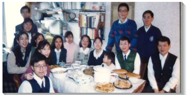
▲在莫斯科開展的華語聖徒交通

記得一九九五年十一月十九日晚上到達俄國莫斯科機場，大地已經覆蓋了一層厚厚的白雪，接機的弟兄們先把我們載到訓練中心，將夫妻與姊妹們安頓好之後，繼續行程。車上只剩四位弟兄，一位英語同工開車，一位會說英語的俄語訓練學員，兩位華語同工。路途中因要尋找加油站加油而迷路，等到加完油，在路上又遇到警