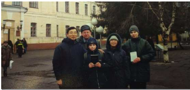
▲ 聖徒們訪問北極圈的城市，零下 40 度

主在身體裡的呼召： 一九九二年弟兄們開始在全台島呼召受過訓練的全時間者赴俄開展。那時我想一定不是我。因為我剛下鄉開展，真理裝備不穀，生命幼嫩，語言不行，所以就沒有報名海外開展。一九九三年八月我調回訓練中心服事一年。一九九四年弟兄們鼓勵輔訓全部到俄國開展。那時我並不清楚主的呼召，但是主給我雅歌書一章八節『…你若不知道，只管出去跟隨羊群的腳蹤…』。所以一九九四年九月十