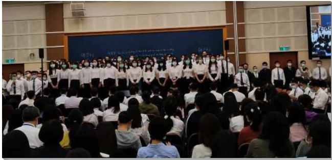
▲各大區青職聖徒上台展覽

本次共有六篇信息，加上『職場』、『婚姻』兩個專題。第一篇的信息說到：當我們看到世界局勢的許多改