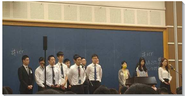
▲青職聖徒們奉獻並宣告

在已婚有小孩的場次，有人題問召會生活因有孩子後，變得更忙碌，長輩的壓力、孩子晚睡…等問題，弟兄幫助我們，我們的心要先轉向主並享受主，標準由主來衡量。至於時間觀念，不作完美主義者，配偶、孩子，可能都是神用來破碎我們的完美主義，不完美乃是訓練我們仍在主面前喜樂。我們因著忙碌，常忘記停下來，為著『家』好好經歷主的注入禱告，並規律的尋求主來引領。要堅定持續的禱告，有信心與盼望，聖靈自會作成。與會的青職聖徒中，有的是被尋回剛恢復聚會