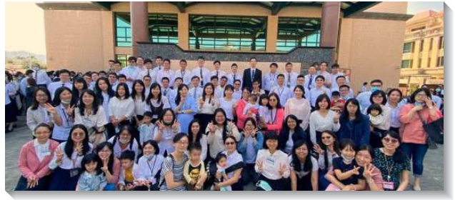
▲各大區青職聖徒踴躍參加青職特會

在『職場』的專題上，講者以『神是那惟一，你要將神擺在那裏』的圖片，告訴我們：凡事先尋求神的國和神的義，我們所要的，神都加給我們。而在『婚姻』的專題中，有未婚、已婚無小孩、已婚有小孩，分為三個場地進行座談。在未婚場次，大家雖有許多的疑問，但弟兄鼓勵我們，看似很多問題，卻都不是問題，因為基