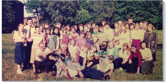
▲ 在俄國的聖徒們戶外相調

個人的蒙召： 一九九四年我們來到莫斯科時，召會才成立三年，聖徒都很年幼。因著社會的背景，有很多聖徒來自離異的家庭，人際關係非常複雜。當時經