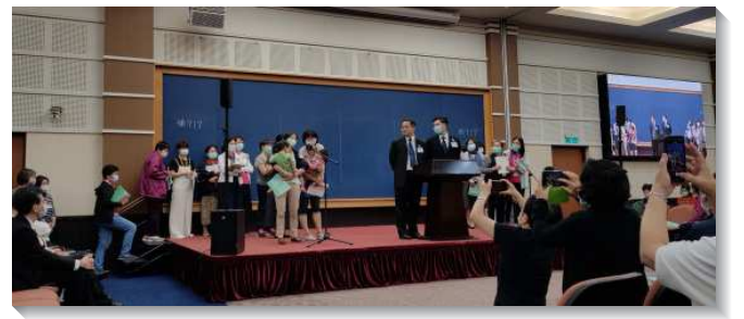
▲ 姊妹們於事奉集調中扶子攜幼上台分享

許多姊妹見證她們在緊湊忙碌的生活中仍能忠於所託，牧養群羊，維持生養生活並進到移民開展的負擔中。包含藉著每天與同伴為移民開展的負擔禱告，有分身的水流，與主同工，甚至利用無遠弗屆的網路資源，打破空間的限制，與當地聖徒在線上配搭牧養。也有會所編組成軍，每週差派人實際前往當地有實際的開展行動，將這國度的福音傳遍居人之地，好響應『禱告去、財務去、人去』的負擔。