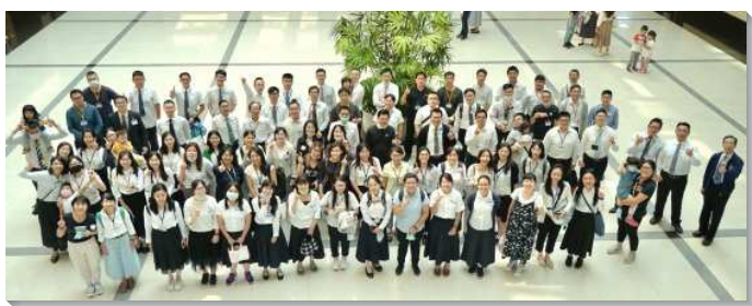
▲聖徒們踴躍參加青職特會

這次特會結束後，弟兄姊妹們開始調整自己的生活，加強屬靈的追求與神命定之路的實行，盼望藉著與祂合作並配合，使主能藉著我們來完成神的經綸。（李芸瑜）