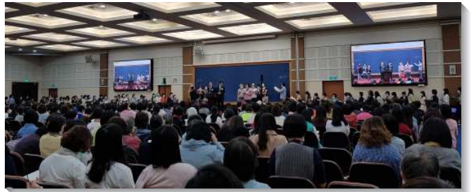
▲ 姊妹們於事奉集調中踴躍分享

在這次的集調中也有關於移民開展，及建立福家架構養成生養習慣的負擔交通與見證。移民開展的目的，是要使召會生活完全的恢復擴展出去。『就在那日，耶路撒冷的召會大遭逼迫，除了使徒以外，門徒都分散在猶太和撒瑪利亞各地』（徒八1），使徒留下來，門徒卻分散了，『那些因司提反的事遭患難四散的人，直走到