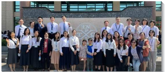
▲聖徒們參加青職特會

為使青職聖徒能更有交通，建造得更緊密，八月下旬有二十六位青職及社區聖徒驅車前往台南，有分於