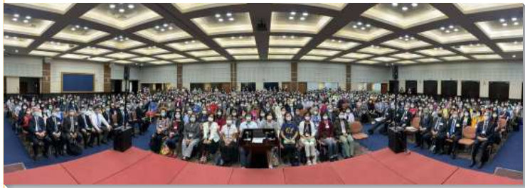
▲ 聖徒們參加第一梯次全台姊妹事奉集調

本次訓練共有八篇信息，乃以『活在主即將來臨的光中，過我們的基督徒生活與召會生活』為主要的負擔。第一篇說到今世不僅是恩典時代、召會時代，也是奧祕的時代。而這奧祕的世代將要終結，最終神的旨意要達到完全並完成。第二篇至第四篇說到我們的基督徒生活，乃要在主即將再臨的光中，儆醒豫備自己，成為精明的童女，為自己買油，天天被神的靈充滿浸透，並將國度的福音傳遍居人之地。然而，我們若要作主耶穌的跟從者，就需喪失魂生命，重複祂在地上的生活，好得著信心的結果—魂的救恩。在主的託付上及祂的恩賜上忠信，作按時分糧的好管家，忠信牧養主所託付的，兌換銀錢，為主賺取利潤！