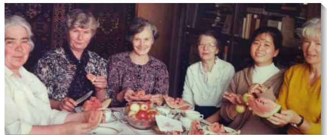
▲姊妹們參加長青排

生活 ：二〇〇二年二月，我調到聖彼得堡繼續服事大專，和俄國同工及學生住，在生活上比較受限制。基本上我已經很習慣俄國食物，不吃中國食物也不會難受。我喜歡吃的水果，有機會吃就吃，不吃也一樣可以過日子。我發覺自己的生活越來越簡單，也比較容易滿足及心存感恩。每逢學生訓練或者冬夏季訓練，因著人數眾多，食物有限量，常會吃不飽。有位台灣同工弟兄說，他每次都是吃十幾片麵包，多喝幾杯茶，來填飽肚子。感謝主！或飽足或飢餓，我們都在祂裏面學得祕訣。