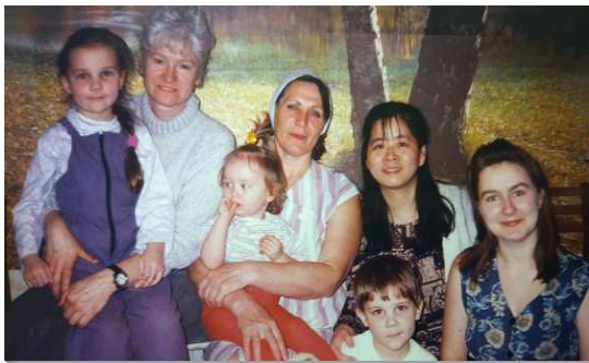
▲聖徒們看望媽媽和兒童

一面，服事是很忙碌的，但另一面與主的交通是如此親密無間。在許多下雪寒冷的夜晚，一個人走在回家的路上，並不覺得孤單，因我的主與我同在。越在內室與主交通就越渴慕認識祂的豐富，有一陣子讀了很多歷代聖徒的傳記，關於禱告的書籍，倪弟兄文集，生命讀經。享受和同工們真理的追求，那時我經歷到神聖的遷