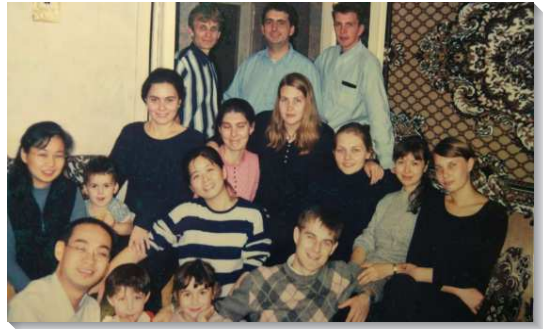
▲聖徒們參加大學生小排

服事 ：一九九四年來俄國後，我被安排在莫斯科二區服事，接觸的姊妹大多是比我年紀大的年長姊妹，還有一些已婚或者離婚的姊妹們。她們的家庭有許多的問題，例如酗酒、毒癮、外遇、失業…每次和她們交通，似乎她們的問題都比主來得實在，服事上我非常的受挫，主的話一再的鼓勵我：信心的工作，愛心的勞苦，盼望中的忍耐。與哀哭的人同哭，與喜樂的人同樂。每次的看望，不是去解決她們的問題，而是與她們一起享受主、信靠主。經過一段時間後，在身體的配搭裏，她們的丈夫一個一個得救，我與她們一同喜樂且將榮耀歸給神！我不完全但在身體裏，其他人補足了我的缺欠。