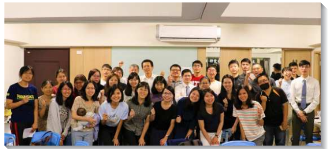
▲聖徒們參加青職福音愛筵

聚會末了，有一對照顧家夫婦分享他們的經歷。弟兄見證他四十歲時因身分轉換必須求職，箴言三十章八至九節成了他常有的禱告。儘管有屬地的憂慮，但他專一信靠主，知道主必顧念他們家的需要。姊妹也見證，因為看見我們的定命乃是獻給神作燔祭，結果乃是『一堆灰』，因而向著主有強的心志，要為著神