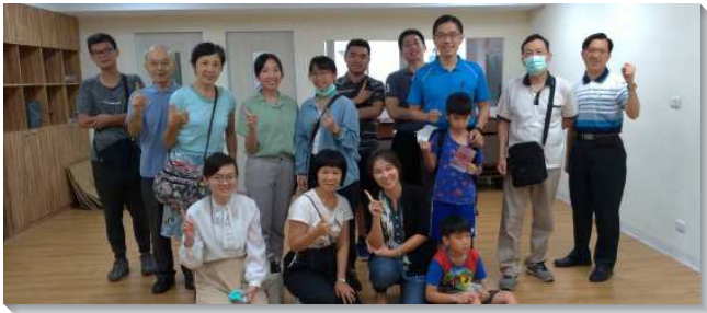
▲聖徒們週週外出傳福音

我們就從九月開始正式啟動週週外出傳福音行動，藉著各區聖徒先在禱告聚會中同心合意為福音訪人代