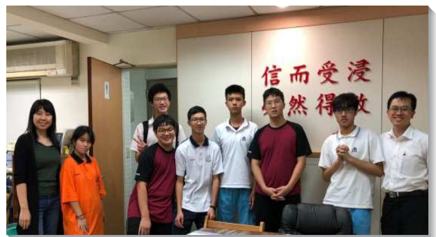
▲青少年聖徒參加校園小排

感謝主，在雅各書五章七節所說『所以，弟兄們，你們要恆忍，直到主的來臨。看哪，農夫等候地裏寶貴的出產，為此恆忍，直到得了秋雨春雨』。在身體的交通與代禱之下，陸續有青少年弟兄姊妹加入校園