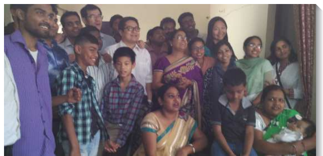
▲ 聖徒到印度傳揚福音

有一次我和聖徒們到一個沒有教會的地方傳了五週的福音，五週內有一百多位聖徒得救。其中有位青職聖徒，非常受主話的吸引，天天與我們享受主話、唱詩歌。開展結束後，他仍是非常渴慕召會生活，就與當地剛得救的新人持續過召會生活。因為他對真理深深渴