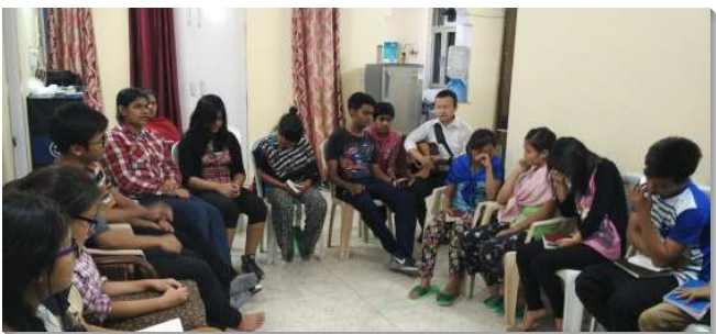
▲ 在印度的聖徒們禱告

就在我決定要赴海外開展時，我的兒子生病了，他得了急性淋巴白血病，這是我人生的低谷，也是人生的轉捩點。我和姊妹花很多時間，來到主的面前尋求祂，也求主的煉淨。現在回想起來實在非常感謝主量給我那段時間，讓我主觀的認識主，也認識裏面的己。當我裏面清楚主醫治了兒子，我沒有忘記自己對主曾經有的奉獻，因而全家更新奉獻，一同有分主在印度的行動。