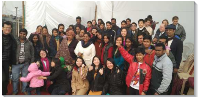
▲ 聖徒們至印度開展相調

印度是一個很美的國家，它之所以美，就在於有許多年輕人。印度也是一個大國家，有二十二種官方語言，當我們跨了一個州，可能就是完全不同的文字、語言、食物、衣著。就著外面，我們就不斷的被擴大；就著裏面，有更多的否認己、釘死和復活。最為寶貝的就是真