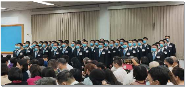
▲參訓學員們展覽詩歌

聚會正式開始前，學員們引導眾人至訓練中心各樓層參觀，有寢室內務的展示、訓練沿革的介紹、以及記錄歷屆學員於世界各地傳揚福音的海外開展展覽館。藉著這樣的導覽，讓人看見學員們在訓練中心所過的乃是與世俗有別、簡單卻甜美的生活，從他們身上散發出的喜樂，不僅叫人看出有神在他們中間，更使來訪的親友和聖徒心得溫暖並且備受激勵。