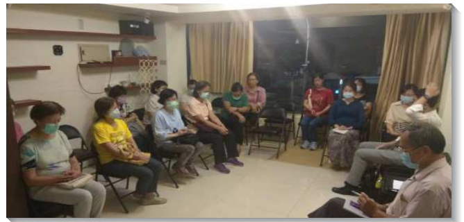
▲聖徒們一同守望禱告

當八十會所成立之日，我們真是看見神的榮光充滿了整個帳幕，感謝讚美主！聖徒們受激勵，藉著更多享受主話，主觀經歷話中之水的洗滌，也將對話的享受應用在會所重要的行動上，且有更新的奉獻，願意拚上我們的時間、財物和全人，竭力的開展，過流進、流出的生活，實際有分身體的行動，擺上自己的一他連得，為主賺取利潤！願主繼續得著祂的召會，繁殖基督，向外擴展，直到主回來！（何育慈）