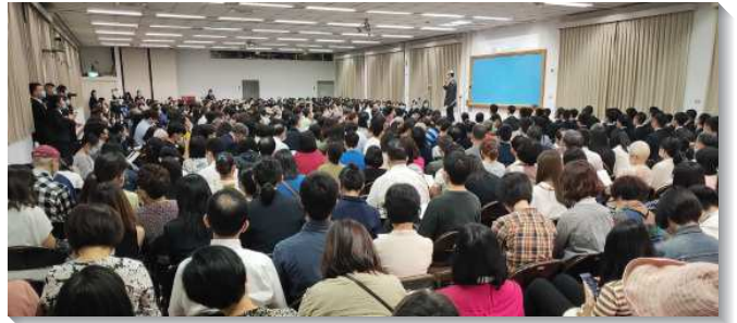
▲全時間訓練中心家長開放日

接著有七位學員，見證他們如何從世界分別出來參加訓練。他們各個擁有令人稱羨的學歷和工作，但當他們看見主的寶貴和訓練的異象時，裏面就興起了一種渴慕，盼望能接受主更多的裝備與成全，好構得上神今時代的需要，因此他們欣然放下自己的所有，投身這榮耀的訓練！另有七位學員，見證這幾個月的訓練使他們得成全，在真理上得裝備，在生命裏有長進，在事奉上更是能憑主話放膽，並且藉著享受主而與人有同心合意的配搭。更有一對參加過訓練的夫婦見證，訓練為他們日後在職場和家庭生活上所帶來的幫助。這些馨香的見證實在是鼓舞人心！看見學員們在訓練中心接受的操練與成全何等有價值，且是為他們一生在事奉和生活上打下美好的根基。