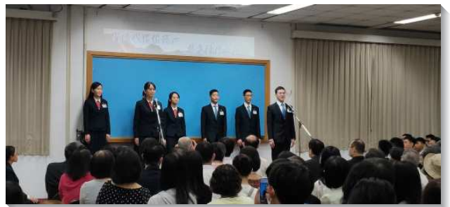
▲受訓學員們分享參訓見證

此外，也有兩對學員的父母親分享兒女在訓練中的成長與改變。他們見證，自己的兒女不僅在性格上變得更溫柔、謙卑，日常生活中也堅定持續的禱告、讀經、追求書報，並忠信的實行神命定之路的教導，拿起牧養的負擔，殷勤的將基督的豐富供應給家人、朋友以及身旁的人，這樣分別的生活是何等的榮耀與喜樂！家長們對訓練的肯定，對學員們實在是莫大的鼓勵！