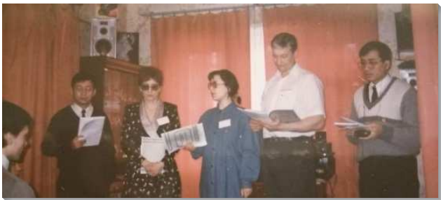
▲在俄國的聖徒們參加聚會

當我們入訓時，看到即將赴俄開展的弟兄姊妹，屈膝奉獻禱告，其中有人奉獻願意向著俄國人就作俄國人，有人將一生奉獻給俄國。那場聚會中所散發基督的馨香之氣著實征服了我們，若不是基督的愛困迫吸引他們，無人能有此奉獻。過了一年我們全體到安那翰參加夏季訓練，並參加美國訓練學員的畢業聚會，李弟兄問學員一個問題，『你們誰可以去俄國開展？』場內一片安靜，而我裏面則是蹦蹦跳。我跟主說，如果李弟兄現在問從台灣來的學員，我一定站起來答應呼召。當時無人回應，李弟兄就說：『你們有四十位，四十是個受試驗的數字，願主親自向你們說話，帶領你們』。後來才知道李弟兄希望美國學員以到美國校園開展為優先，而台灣去的學員雖然有心想去俄國開展，但需要先下鄉開展一年後再報名，於是我就南下到高雄縣的路竹、湖內、茄定鄉開展。一九九五年十一月我有機會赴菲南開展，第一次嚐到在新人裏開展的喜樂，也奠定了我赴俄開展的心志。