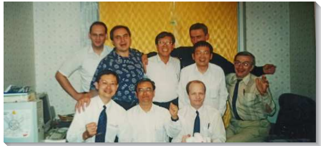
▲在俄國的弟兄們相調聚會

在俄國開展，我們常常是搭火車，火車到不了的地方才搭巴士，在火車上過夜是常有的事。通常我們都會買臥鋪，臥鋪有一種是可以關門的，另一種是沒有門的，沒有門的反而安全一點，除非整個包廂都是熟