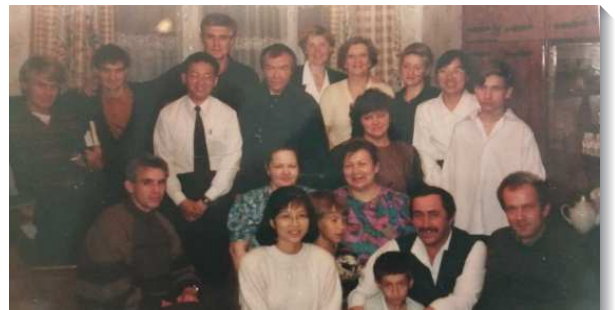
▲在俄國的聖徒們一同交通

每次到達目的地的時間不一，有半夜三點、清晨五點、有白天、有晚上，弟兄姊妹半夜走在冰雪中來接我們到他們家裏，雖然素未謀面卻猶如相識甚久的親人。每每交通一整天，人不斷的加入，只因為渴慕這分新約的職事，和尋找按著這分職事生活聚會的團