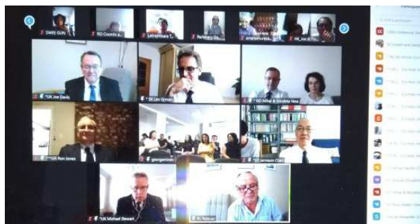
▲各地聖徒參加線上特會相調