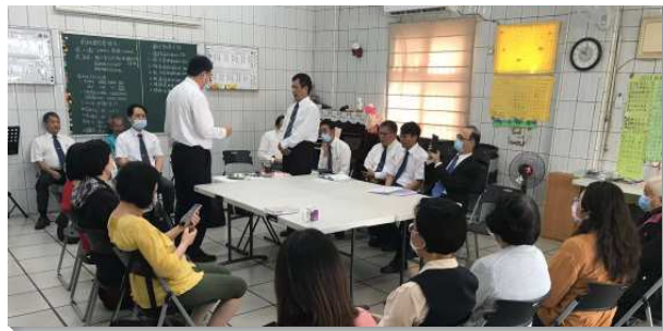
▲聖徒們一同配搭荊桐鄉召會開展

二、家聚會：因著這樣的福音行動，前往配搭的聖徒們裏面的恩賜再度如火挑旺起來，回到台北後，持續與留下名單之福音朋友保持聯絡，並與他們讀牧養材料，且交接給後續前往配搭的聖徒們看望、牧養。