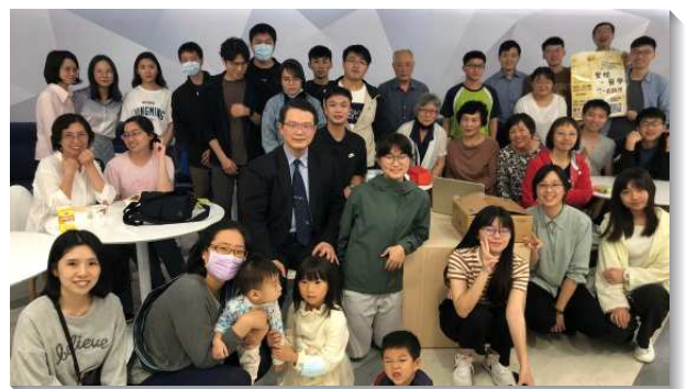
▲聖徒們配搭大學校園福音講座

在十一月二十五日，我們首次在國際醫學中心舉辦校園福音講座。在近兩個月的籌備過程中，聖徒們在各樣的聚集裏不斷的為關心的小羊迫切禱告，結果當天有超過三十五位福音朋友前來參加，這實在是主的作為。之後我們藉著家聚會持續餵養小羊，使他們成為常存的果子，也邀請他們參加校園小排，能聯於身體中，小排人數因而逐漸增加，現已準備增排了。求主繼續祝福祂的召會，榮耀歸給神。（張博喻、鄭云卉）