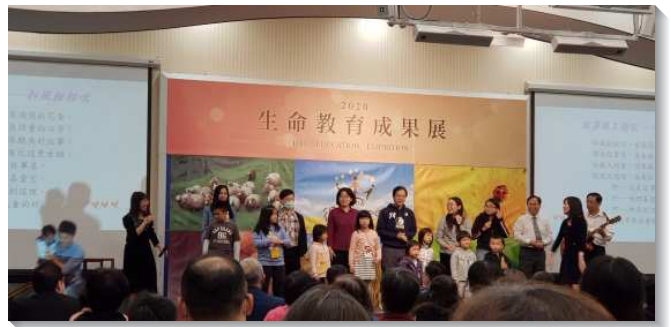
▲北市第四志工團展覽生命教育故事屋

少年教育專案』此項資源，除了由基金會提供獎助學金給有需要的高職同學，陪伴的志工們更投注大量心力，長期在生活上關懷他們。這班得榮少年演出短劇『你很特別』，不僅展現他們在生命教育課堂上所學的，更受到現場眾人一致的好評與肯定。