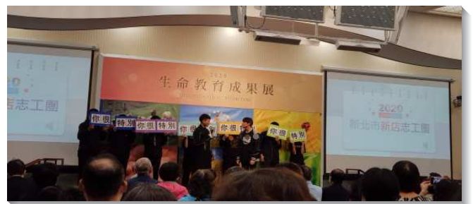
▲得榮少年演出短劇『你很特別』

新北市永和志工團藉由大學通識課程，將生命教育帶給大學生。課程中除了關心本國學生外，也接觸到由海外來台讀書的學生。生命教育課程讓這些短期來台讀書的留學生滿有深刻的印象，可說是另一面的海外開展。