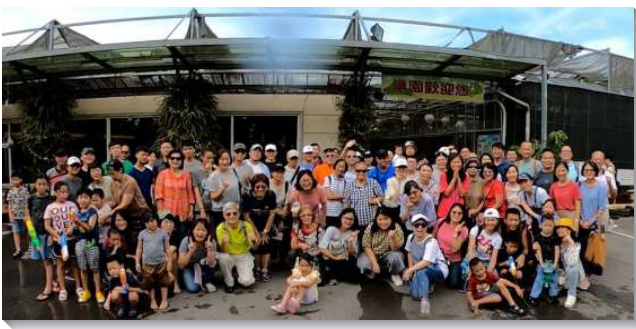
▲聖徒們邀請福音朋友外出相調

從七月份起，弟兄們打負擔要恢復加強排聚集，並往前到排生活。雖然各小區的情況不同，但是藉著同心合意的交通，各小區都領受同一個負擔，竭力向前。結果有的小區多年停掉排聚會，現已憑信恢復排聚集，排聚會人數逐月增長；排聚集仍待加強的小區亦憑信加強家聚會和傳福音，排聚會人數也逐漸增加。