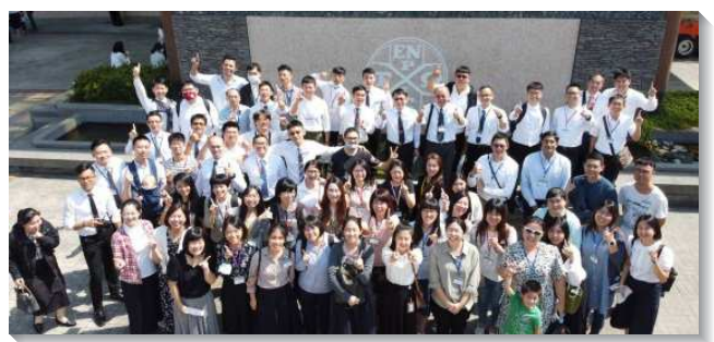
▲港湖大區聖徒們參加青職特會