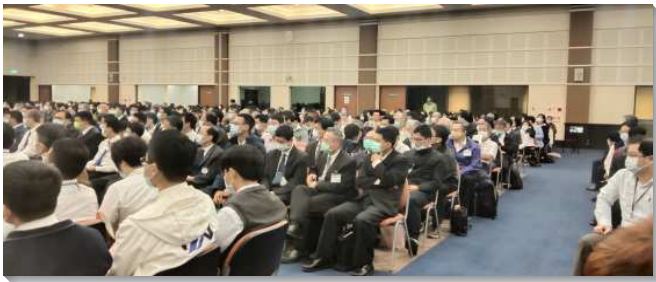
▲感恩節特會暨禱研背講在中部相調中心舉行

本次特會共六篇信息，第一篇信息交通到『我們的文化急切需要被包羅萬有、延展無限的基督頂替』。使徒寫歌羅西書的背景，乃因文化已經充斥在歌羅西的召會中（西二8）。神的仇敵利用文化來頂替基督，使聖徒被文化打岔而離開基督。在歌羅西書，『黑暗的權勢』特別是指文化以及我們天然人好的一面（一12~13），因為任何代替基督的事物都成了控制我們的黑暗權勢。人類文化的產生，是在人墮落之後興起的（創四16~22）。該隱離開神的面之後，為著保護和自存，就