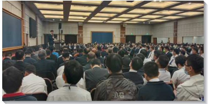
▲聖徒們參加感恩節特會暨禱研背講

之包羅萬有、延展無限的基督。本篇有三個重點，第一是文化這隱藏的事必須被暴露，第二是我們需要基督的啟示，第三是我們需要有新人的異象，使我們能增加對新人的感覺。歌羅西書三章十一節『在此並沒有』，說出在新人裏不同文化的區別不可能存在。而『基督是一切，又在一切之內』說出基督是一切肢體，又在一切肢體之內，祂乃是新人的構成成分。我們必須被基督漫溢，並讓基督生機的作到我們這人裏面。至終，我們就會被基督頂替，然後一個新人就會實際的在我們中間出現，我們也會實現新人的生活。