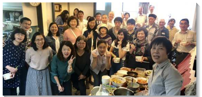
▲聖徒們彼此牧養人數增長

我們在這過程中學習到『只憑信心，不憑眼見』，藉家聚會相互牧養，排聚會彼此教導，讓主的話在召會生活中繁增，主就把人加給我們。展望近期二個區至少再增加一個小排，冀使召會生活結構更健康，願主繼續祝福祂的召會，使我們剛強壯膽與祂一同開展神的國，成為神經綸中有時代價值的人。（張正中）