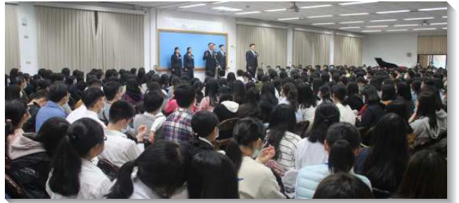
▲訓練學員分享參訓蒙恩

接著學員分享他們如何蒙召參加訓練的見證，以及在訓練中受成全的蒙恩。有弟兄見證他得著了成就和人的稱羨，卻仍覺得乾渴，主光照他，地上的水只會叫他再渴，惟有主這活水是他的滿足；同時看見主在地上有一個需要，便奉獻自己，受訓練成合用器皿。有位姊妹在進到醫院實習後，發現這世上並不會因多一個醫生而改變，然而神卻會因少了一個與祂經綸配合的人，而使祂的權益受虧損；也看到兩千年來只有馬利亞抓住了機