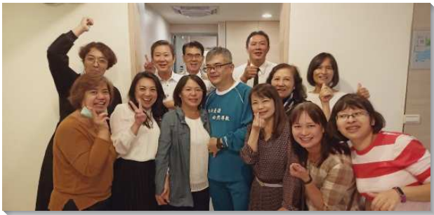
▲聖徒們為新人得救歡樂

三次福音聚會，首次聚會就邀請到三十二位福音朋友，另兩次也有近二十位的親友參與。其次，聖徒們也在週六及主日全天接觸人，包括小組邀請人到家裏愛筵、叩訪久不聚會者、每週六下午的公園兒童福音及馬路福音等。聖徒們也積極廣邀福音對象及家人參加一日戶外相調，在車上相調唱詩，使福音朋友感受到愛與關懷。