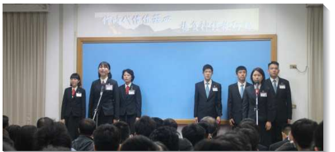
▲訓練學員分享參訓見證

藉著訓練教師的開啟，我們看見若要『擔負神終極行動』，就必須『作時代價值器皿』。神需要得著一班時代價值的器皿作為憑藉，從現今手續的時代，轉移到神心願的時代。但以理是對神有時代價值之人的榜樣，他是從世代分別出來的人，並且不顧一切的反對。我們也該以但以理為榜樣，在這末後的日子，成為對神有時代價值的器皿。並且在神聖的歷史中，神總是呼召青年人，因為青年人不是『定型』的，我們都要問自己，是否『定型』了嗎？雖深受感動，卻害怕奉獻嗎？詩歌一件美事：『已過二十世紀以來，千千萬萬寶貴的性命，心愛的奇珍、崇高的地位，以及燦爛的前途，都曾枉費在主耶穌身上。』是主那不肯放我的愛，像我們如此平常、平凡的人，這位榮耀、超絕的神，竟然看上我們，