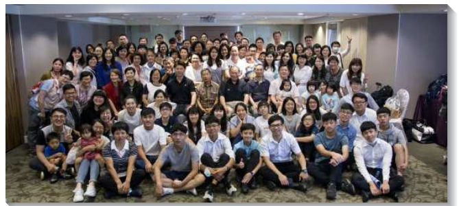
▲聖徒們開家增組增區人數繁增

經過妥善的規畫，眾聖徒加強屬靈基礎工程的建立，實行晨興、禱告、相調的生活，並投入『二帶二開』的實行，區區以帶二位得救，帶二位參加禱告聚會，開一個聖徒的家，開一個福音朋友的家為目標。結果聖徒們的召會生活不僅不受疫情影響，反而積極藉著週間探訪，邀請親屬密友參加主日聚會，並透過網路連線方式送會到家，讓不便出門的親屬密友也能與聖徒們在線上相聚。大家在線上彼此問安，區負責並在會後差派專人，親自拜訪在線上參加主日聚會的