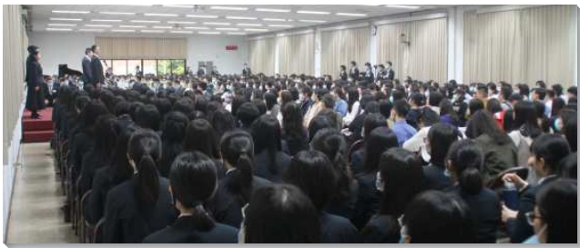
▲全時間訓練中心呼召聚會在三會所舉行

聚會開始時，學員上台與眾聖徒同唱補充本詩歌四二七首『為神永遠的經綸』，『主呼召我們在這裏，是為神永遠的經綸。』聚會的開頭，這首詩歌把我們帶到神經綸的異象中。接著，學員們展覽詩歌三四九首，『眾人湧進神的國度，十架少人負』。詩歌顯明我們常有的光景，並激勵我們樂意宣告：作誠實愛主的人，禍福都不問！最後學員展覽詩歌三五五首，『當人棄絕地的賄賂，前來為神而活，他所得的無限富有，口舌難以述說。』詩歌呼召我們從屬地的纏累中出來，將這交易算看，零碎要換來整個。