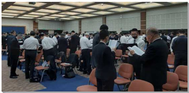
▲ 聖徒們分組交通信息

第九篇信息交通該如何讀箴言這卷書——我們該『用禱告的靈讀箴言，使之對我們成為金塊和珠寶，加強我們追求基督的生活，以完成神的經綸』。享受箴言引領我們『過敬虔的生活』（第十篇），我們該有異象、買真理、操練靈、保守心、滿了愛，好使我們過敬虔生活。