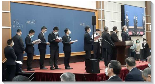
▲ 聖徒們上台分享信息

第六篇信息論到，約伯需要『得著神，好為著神的目的被神變化』。神對自滿的約伯實行銷毀並剝奪，使祂能有一條路，用祂自己重建約伯，並將約伯引進對神更深的追求，使他能得著神；約伯看見了神，使他得著神，好為著神的目的被神變化。變化說出了神與人的關