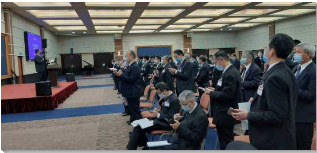
▲ 冬季訓練暨禱研背講聚會於中部相調中心舉行

前七篇信息關乎約伯記的結晶讀經。第一篇信息說到『約伯記裏重大的問題及其其大的答案』。約伯記裏重大問題乃是神創造人的目的是甚麼，以及神對付祂選民的目的目的是甚麼？其重大答案乃是神永遠的經綸，就是神要將祂自己分賜到祂所揀選的人裏面，使他們成為基督的身體，就是新人，終極完成於新耶路撒冷。