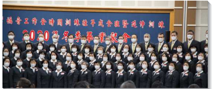
▲壯年班學員們展覽詩歌

程車司機，和她一同參訓的姊妹，每天親自為她朗讀李常受文集，錄音傳給她，使她可以在載客的空檔中聆聽，晚間雖疲累，但她仍竭力追求，為主作一個有時代價值的器皿。一對夫婦之前參加壯年班訓練畢業後，本以為在家中仍可操練，但三個月後，生活越來越鬆散，於是決定參加延伸訓練。這一年的操練使他們深深體認，壯年班的淬練讓『己』被破碎，靈命被更新，藉著享受書報和規律屬靈生活的操練，神聖生命更擴展。