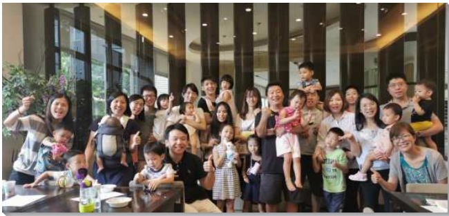
▲父母及兒童們喜樂相調

四十八會所聖徒們關心兒童及青職的繁增，弟兄姊妹迫切且堅定持續的禱告一段時間後，就看見聖靈的工作。近兩年接續搬來了兩個家，經過弟兄們交通後，覺得各個家和幼童，都需要有牧養和相調的生活，好在身體裏彼此建造在一起。感謝主，賜下祝福，讓兒童及青職都能有繁茂的復活。