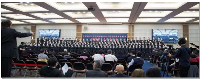
▲壯年班畢業聚會於中部相調中心舉行

本期畢業學員在今年三月初入訓後，雖遇到險峻疫情，終能完成一年訓練。儘管有身體、配搭、或生活上的各種問題，但藉著教師們豐富的供應，將真理、啟示與經歷傳輸給學員們，激勵眾人捨棄魂生命，經歷死而復活的大能，學習作忠信服事的奴僕。畢業學員的見證，實在是神豐富的供應與榮耀工作的成果。