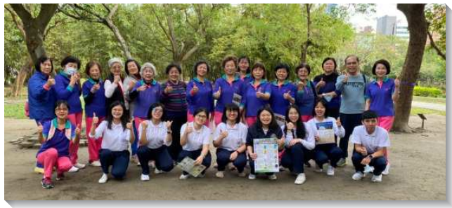
▲學員們向基督徒團體推廣真理

儆醒禱告持定元首，憑信往前享神恩典—書報推廣是一場屬靈的爭戰，我們操練時時儆醒禱告，活在靈裏。這也是我們惟一的祕訣，叫我們持定基督作元首，並與三一神是一。儘管每天行程緊湊，仍謹守穩定的神人生活，享受神作生命，作我們剛強開拓的動力。當我們冒著雨，拖著行李箱，穿梭在大街小巷前往會堂時，都操練與同伴守望禱告，為會堂向這份職事敞開、為購書的聖徒能得著亮光、為主的話在地上擴長起來而禱告。我們的信心就得加強，並經歷主的祝福和恩典超過我們所求所想，神的話語藉著我們供應到祂的眾兒女中間。