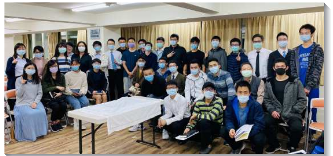
▲學生們參加初信成全暨夜間擘餅聚會

由於校園封閉，校外人士皆不得其門而入，甚至校友如全時間服事者及學員皆不得進入。學生們遂利用已過新生體檢時回收的問卷上所留之聯絡電話，逐一電話回訪，有些當時聯絡不上或原先表示對聖經沒有