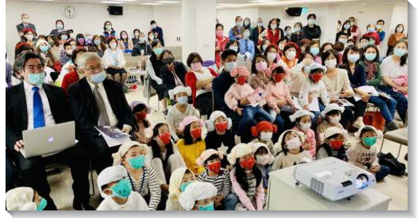
▲七十九會所於二〇二〇年七月二十六日成立

聖徒和在總執事室服事的弟兄們都有代表與會，近一百五十坪的會場中，擠進約二百位聖徒，真是何等榮耀！