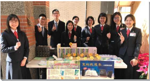
▲學員們至全台各地推廣書報

操練講說職事的話，照耀陳明亮光真理—在書報推廣前，我們率先進入並享受這份職事的豐富，藉著禱研背講十本好書及恢復本經文加註解，使我們更加珍賞並寶貝這份職事。當我們出外拜訪各個會堂時，職事的話對我們就不再是客觀的知識道理，而是主觀的經歷，更成為我們的活出。