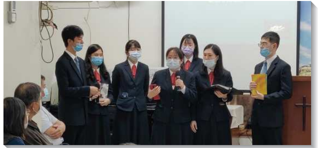
▲學員們至各會堂書報推廣

寶愛珍賞主的恢復，忠信持守神的經綸—『恢復』一辭之意，是一樣東西原初有，後來失去了，現在需要回復到原初的光景。歷代以來，聖經所啟示的真理被遺失、誤會、且被錯誤的教導。因此，需要有主的恢復，恢復神的啟示、神人生活、以及召會的實行。當人問倪柝聲弟兄，我們是什麼，他回答『我們並不是甚麼。我們在這裏不是加入某一派別，也不是創立一個新派別。若非因為神給我們一個特別的呼召、特別的託付，我們並沒有在這裏存在的必要。』在這十天中我們走訪了各個會堂，感謝主將我們擺在祂的恢復裏。主的恢復以聖經為獨一無二的標準，恢復聖經中關於神經綸的中心啟示，所有的實行、教導和操練，都是照著聖言，不與世