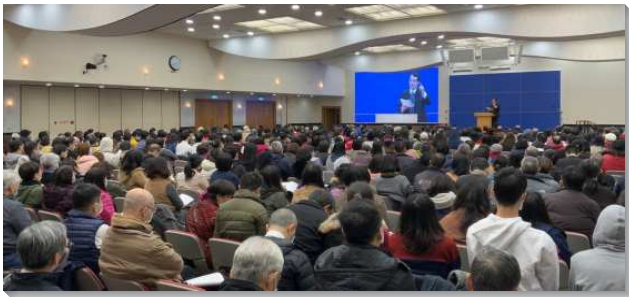
▲信基區冬季現場訓練於信基大樓舉行

第一篇說到約伯記裏重大問題有兩部分，其答案乃是神的經綸。第二篇說到撒但由於美麗心中高傲而背叛神，神特意使他作醜惡的工具，以執行對愛祂之人的對付。主耶穌勝過撒但，我們也要在調和的靈裏勝過撒但。第三篇說到約伯受攪擾，因此，約伯咒詛自己、寧死不活；但保羅從信主，就是一個在神銷毀之下主裏的