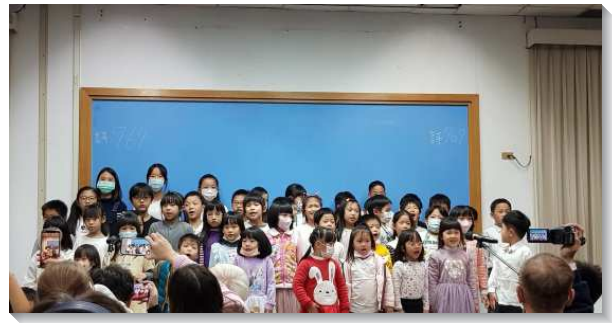
▲大安區冬季現場訓練兒童展覽標語詩歌

本次訓練共有十二篇信息，第一到七篇為約伯記結晶讀經，八到十一篇為箴言結晶讀經，十二篇為傳道書結晶讀經。第一到三篇信息，點出了神永遠的經綸，就是神要將祂自己分賜到祂的選民裏面，終極完成於新耶路撒冷。為了完成這經綸，撒但被神特意用作醜惡的工具，來剝奪並銷毀祂的聖民。第四到七篇信息，說出被剝奪並銷毀的結果，使祂的聖民從善惡知識樹的源頭，轉向生命樹的源頭；從一個好人變化成為一個神人。第