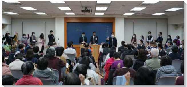
▲城中區冬季現場訓練於一會所舉行

特別本次在考試上有相當的蒙恩，弟兄們幫助眾人考試時，需要消化信息，用靈推出，並帶領台下的弟兄姊