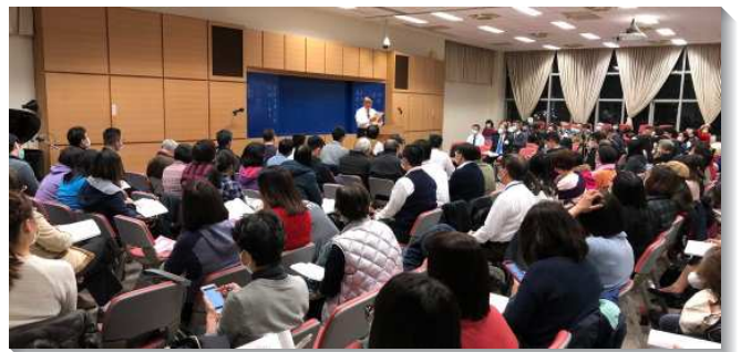
▲大同區冬季現場訓練於四會所舉行

主給我們看見一個屬靈的榜樣－保羅，他憑著基督的生命來生活，不論在何種處境都學得祕訣，靠主得勝。他看所臨到他的環境不過是短暫輕微的苦楚，為要成就永遠重大的榮耀，環境是顯大基督的機會，將人作成耶穌的見證，成為祂在地上的彰顯。