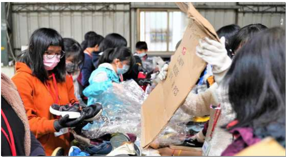
▲得榮少年分組分工將物資分類

本次公共服務地點位於新莊的舊鞋救命協會，這是一個專門募集舊鞋、舊衣，以幫助非洲貧困地區居民之機構。少年們聆聽過簡介及服務前的說明後，即分為四組：分類組、打包組、運送組、拆箱組，開始行動。