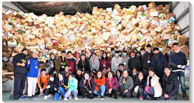
▲得榮少年至舊鞋救命協會參與寒假公共服務

中午用餐後接著是生命園地。本次生命園地的講者是兩位叔叔，他們是相識二十年多的朋友。徐叔叔國中時結交不好的朋友，漸漸不愛念書，甚至開始為非作歹。有一次因仇家而受傷，被送進醫院，母親探望他時留下傷心的眼淚，他決定不要再讓母親傷心，要找正當的工作。後來從攝影學徒開始做起，累積經驗後自己創業。之後卻沉浸於賺錢、喝酒、享樂中，身體出了問題。從