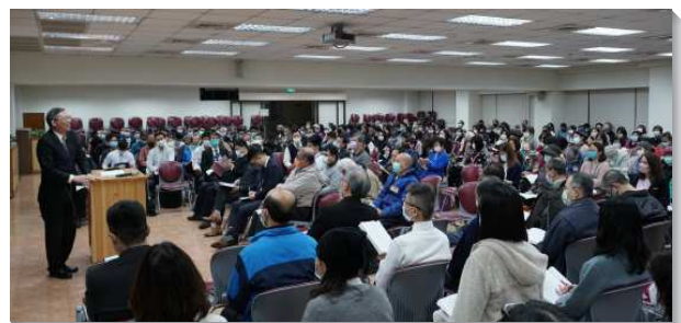
▲城中區冬季現場訓練於一會所舉行

現場訓練中，每場聚會先有兩位弟兄配搭供應信息，另有兩位弟兄在信息後加強重點，加上信息前的考試，與信息後的分享，人人都有機會操練講說主今日的說話，使這分新約職事成為眾聖徒在基督身體中普遍的說話。現場訓練期間，各會所輪流配搭豫備晚間的飯食，使眾人不僅靈裏因主的話得飽足，更在甜美愛筵中享受基督身體肢體間彼此的相顧與牧養。願主祝福並加強祂的召會，使我們在一樣的心思裏，用同一的口，說一樣的話，帶進一個新人在地上的顯現。（張志誠）