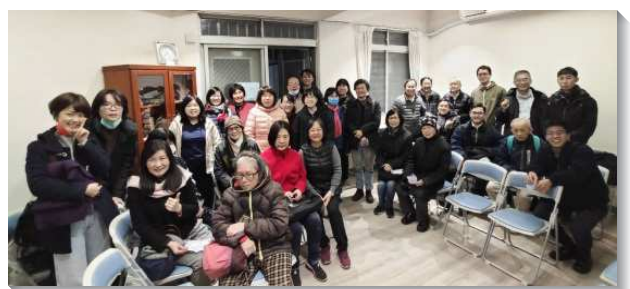
▲聖徒們一同配搭福音開展

有學員姊妹見證，有次她與一位對人生絕望的女士陪談到晚上十點半，對方卻未受浸，難免有些失望，但藉著身體的代求，經歷平安的神將撒但踐踏在召會的腳下。讚美主！我們看見每一次的開展都是神在我們裏面的行動，未來在萬華區國興路、青年路這區域將成立新的會所，不論會所的購置、人數加增、專項服事的建立，都還需倚靠主的恩力繼續爭戰往前，願主無限的祝福，讓祂的召會見證剛強明亮。（許聖倫）