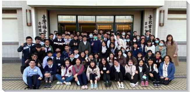
▲ 士林北投區大學期初特會於忠義訓練中心舉行

信基、港湖、文一大區 的期初特會於信基大樓舉行，共有一百零一人參加。特會期間將各校學生編入小組，兩天分別豫留十五分鐘守望禱告時間，幫助學生不僅收心豫備學期開始，並更新奉獻新學期能在校園中有突破和往前。特會中安排專題和活力排交通時間，實際示範