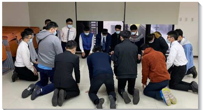
▲ 城中大同區大學聖徒屈膝禱告

士林大區 在這次期初特會中，交通到我們必須看見異象，並使異象翻轉我們的生活。在結束之時，弟兄們吹號：每個弟兄姊妹既渴慕作得勝者，就要去接觸並關心同學，藉著牧養自己的朋友，而把人帶進並穩定在召會生活中。學生們以校園為單位一同上台奉獻，幾位原本害怕去接觸不熟悉者的學生聖徒，也宣告在這學期要為著福音的緣故，接觸同學並為人提名守望禱告。