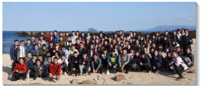
▲大安區的大學生到野柳相調

在專題交通中，藉著負責弟兄、服事者的見證，以及全時間受訓學員的展覽，激勵學生們從年幼就要心中立大志、設大謀，答應得勝者的呼召，與主完全配合。願主加強學生們，於開學後都能在各校園作主明亮的見證人。（游睿瀚、林蔚穎）