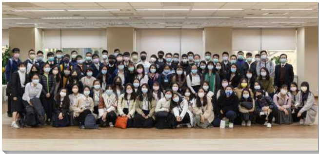
▲ 信基、港湖、文一大區期初特會於信基大樓舉行

藉著進入啟示錄，帶我們看見在這末後的日子，這卷書對我們是極其重要的。前三篇信息說到，我們要享受並經歷啟示錄中所啟示出來的基督，並渴慕成為耶穌的見證。為此我們要答應得勝者的呼召，因為得勝者顧到神的權益，過於他們日常的需要，好得著基督的身體，