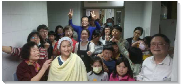
▲青少年受浸歸主，眾人喜樂

在豫備特會內容時，服事者們有許多的交通。因著此次特會成員從大專生到小學生都有，恐怕信息太高，孩子不易領會。最後，在真理高度不減的情況下，我們真是見證『神的話擴長起來，門徒的數目就大為繁增』，除了特會中有一位大學生、三位青少年受浸外，特會後更有兩位高年級兒童受浸，讚美神！