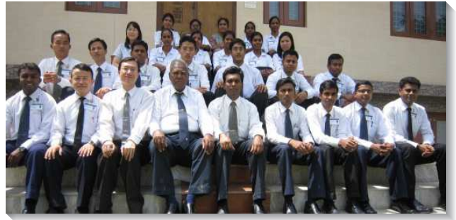
▲聖徒們參加在印度的訓練

在印度傳福音時，我嘗試著問他們三個問題：第一，宇宙中只有一位獨一的神嗎？幾乎所有人都贊同；第二，耶穌基督是神嗎？也幾乎沒有任何人反對；按著邏輯，很自然地進入第三個問題，所以神就是耶穌基督？此時，幾乎所有的人不同意。這對我的邏輯思考確實是個挑戰。漸漸的，我領會到向印度教徒傳福音只符合邏輯是不管用的，還需瞭解他們的宗教哲學思想。他們用哲學，很巧妙的將一神與多神融合為一，很哲學的使一神與泛神也能和諧共存。因此，在印度傳福音很大的挑戰之一，並非被拒絕，而是當你說完之後，完全被接受，並被總結為：你所說的和印度教一模一樣。講三一神，他們有；論成為肉體，他們也有。在印度傳福音，