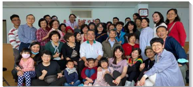
▲聖徒們至壯圍鄉召會相調

聚會中大家說一樣的話，供應一位基督，如同詩歌上說的：『基督是我的，也是你們的…同是身上肢