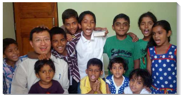
▲聖徒到印度開展傳福音

極大的福音盼望—印度是全世界傳福音最有盼望的國家，因為她擁有以下特點：第一，印度是全世界年輕人最多的國家，三分之二的人口在三十五歲以下，要得青年人非此地莫屬；第二，印度是全世界最大的英語國家，在超過十二億人口中，有將近四億人口可以用英語溝通，因此，世界各地都有弟兄姊妹來此配搭傳福音；第三，印度是全世界最大的自由民主國家，這裏傳福音完全自由，接受福音沒有問題；第四，印度是哲學家最多的國家，倪柝聲弟兄說：『印度人的哲學高於普通人甚多。』換句話說，大街小巷，挨家挨戶都可找到願意和你談信仰的人；第五，印度是千言萬語的國家，擁有全世界最多的語言、最多的種族，得著印度人可使各族、各國、各方言的人都事奉祂（但七14）。