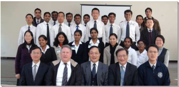
▲各地的聖徒們至印度訪問

我於二〇一二年至二〇一四年到印度開展。人說印度是個永恆的國度，剛來到印度時，我以為他們因著性格不好，生活鬆散以至沒有時間觀念。漸漸的，我體會到，他們生在循環裏，活在永恆裏，長在無限中。白天過後是夜晚，夜晚帶進另一個白晝；出生是面對死亡的開始，死亡是另一個生命的開端。今日上午九點，和明天的上午九點差異不大，這週一與下週一，若一同放在永恆裏，並無二致。火車總是會來，飛機終究要起飛，活在這個國度裏的人，沒有這些慌張的反應，他們的氣定神閒似乎在告訴你，人生何必這麼急呢？