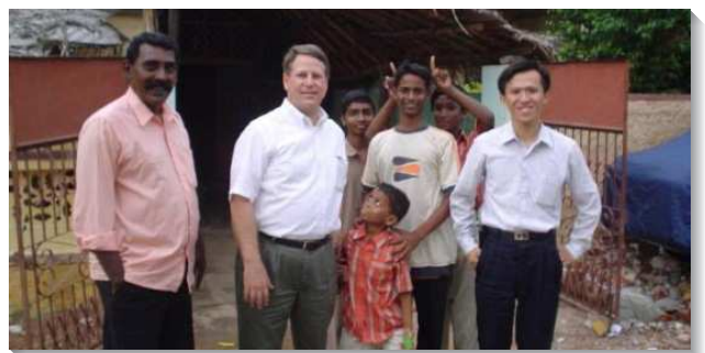
▲弟兄們配搭到社區探訪

抓住機會： 往年聖徒報名海外開展，還需經過幾關的面談，所以，當我寄出報名表後，仍心存猶疑，一度也有想收回的念頭。但無論如何，在我深處總有個感覺告訴我，要為主抓住機會。有一天，一位服事的弟兄打電話給我，問我的英文程度如何，因為弟兄們希望差遣我們到印度開展，本來我想回答我的英語能力不好，但主在裏面有加強和催促，我就在信心的靈裏回答弟兄說『還可以』。在赴海外開展前，弟兄們邀請我們用餐，交通中得知已經通過考試，這才讓我放下心中的擔憂，便能豪邁的踏上旅程。