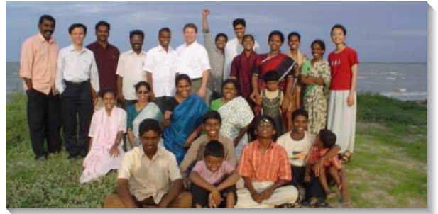
▲聖徒外出相調彼此牧養

更新奉獻： 完成訓練後，從二〇〇一年起我就在板橋市召會配搭，因為忙於服事，海外開展的心願也暫時擺在一邊。後來主興起環境，題醒我曾經向主的奉獻，特別在二〇〇三年二月，有弟兄帶領台北縣同工們到中國大陸訪問，主題是『基督教在中國二百年之