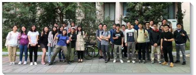
▲大專生在校園中傳揚福音

儘管受疫情影響，人與人的距離變得疏遠，主仍藉著環境興起弟兄姊妹對同學、朋友得救的負擔。藉著天天為人題名代禱，在生活中湧流神聖的愛，供應神聖的生命，並將人帶進召會生活。本次福音節期三個會所共有十五位同學受浸，其中八位更是弟兄姊妹長期接觸的熱門對象。願主祝福每位新人，都成為常存的果子，受成全成為召會建造的材料。 (張存信、劉家福)