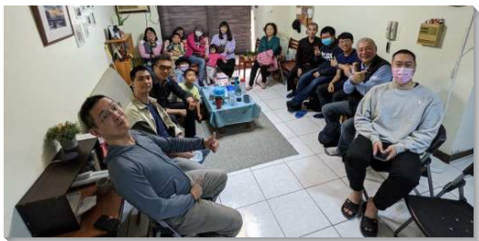
▲聖徒們春節至返鄉聖徒家中探訪

二月進入國際華語特會信息結束後，弟兄姊妹就前往中彰投探訪返鄉的聖徒們。受訪聖徒的家人多未信主，盼望藉著這次家訪，使他們的家人看見召會生活的喜樂。本次出訪的家都帶著孩童，兒童們年紀雖小，但在福音上都盡上功用。每進到受訪聖徒家中，幾句禮貌的問候就使未信主的親友，心中喜樂敞開。看見兒童們玩在一起，活潑又不失聖別，使長輩們知道自己的兒女是蒙保守的，進而放心讓兒女過召會生