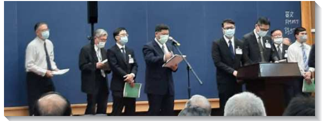
▲弟兄們領受負擔、積極分享

我們必須實行具有戰略性的因素——真正的同心合意。同心合意指我們心思和意志裏的和諧，其維持因素是使徒的教訓，其實行是在一個靈裏，同有一個魂，結果是新約中一切福分向我們開啟。第六篇論到『因素六：為著我們生命的長大並事奉上的用處，對付我們天然的個性』。我們天然的個性就是我們的己，我們須不斷操練我們的靈而拒絕己，並憑另一個生命——釘死並復活的基督——而活，藉此活基督。我們藉著與那靈合作，學習過反對我們個性的生活，那靈藉著十字架殺死的元素、那靈的管治、基督的光照、並召會生活、結果子和餵養小羊，對付我們外面的人、己和天然的個性。