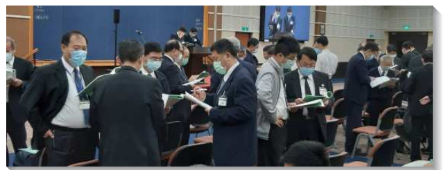
▲弟兄們於會中一同進入信息

第七篇闡明『因素七：相調為著基督身體的實際』。神經綸的最高峰是基督身體的實際。主的恢復乃是為著建造基督身體、建造錫安，所以，我們要竭力達到錫安。為此，神已經將身體調和在一起，我們要為著基督身體的實際而相調，必須經過十字架，憑著那靈，為著基督身體的建造，將基督分賜給別人。此外，神心頭的願望是要那在耶穌身上的實際能重複在基督身體的許多肢體上，而成為基督身體的實際。