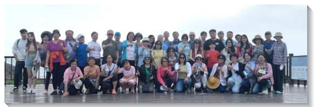
▲ 聖徒們邀約福音朋友出外相調

配合繁增會所的目標，各區先訂定小區內階段性繁增的規劃。按著各區聖徒生活型態或工作特性不同，選擇合適的時段建立小排聚集，並鼓勵聖徒大量接觸人、傳福音，尋訪久未聚會的聖徒。在『福、家、排、區』的架構下，落實『生、養、教、建』的召會生活，人人盡生機的功用，實行神所命定的新路。