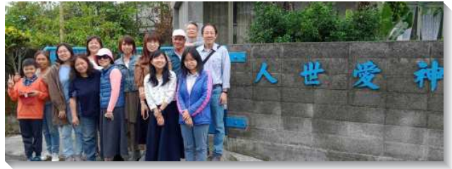
▲ 聖徒們至花蓮縣鳳林鎮開展

再者，開展幫助聖徒們操練『活』基督。福音不僅僅是外出開展、叩訪，活出與彰顯亦是重要。開展期間，我們一同打掃接待的會所，不只是維持環境的整潔，更是自然的流露基督，彰顯耶穌甜美的人性，這就是『福音即生活』最好的例證。