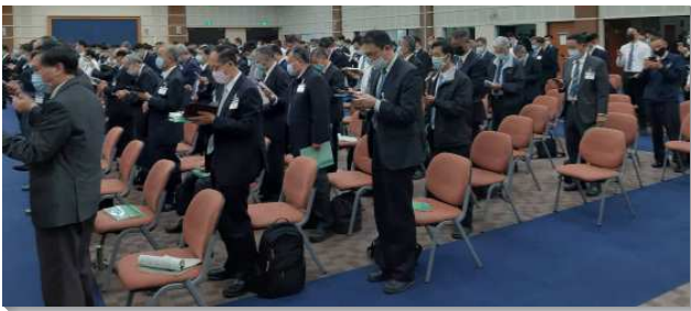
▲春季國際長老同工訓練於中部相調中心舉行

第一篇說到『新的復興』，這復興是我們所看見之時代異象的實行，因此，第二篇論到『時代完整的異象』。第一篇說到『因素一：與主合作帶進新的復興，以終結這個世代』。我們藉著達到神聖啟示的高峰、實行過神人的生活、並照著神牧養，就能進入新的復興，以終結這個世代。其次，第二篇論到『因素二：緊緊跟隨那藉著時代的職事所得時代完整的異象』，每個時代都有那時代的異象。主給祂當前恢復的異象，乃是神永遠經綸包羅萬有的異象及其終極完成一新耶路撒冷的異象。為此，我們需要活出並作出新耶路撒冷。