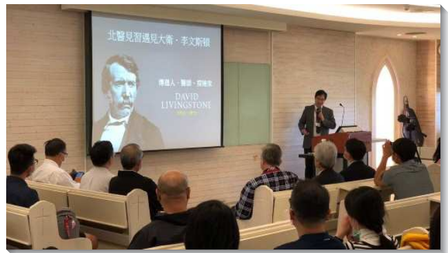
▲聖徒們於馬偕醫學院舉辦福音講座

本次福音聚會特別是為著馬偕醫學院的學生，以醫學講座的型態進行，主題是『醫療人生的另一種面貌—非洲醫療見聞』。主持人是在馬偕醫學院任教的曾弟兄，主講人則是在馬偕醫院任職的黃弟兄，此外更有大學服事五環的聖徒共同參與。黃弟兄分享他在非洲擔任外交替代役的親身經歷，讓學生們認識醫護生涯中的另一種選擇。並且，他在非洲時，不僅執行國家交付的醫療任務，更接觸當地對神的話有渴慕的聖徒，陪他們讀恢復本聖經享受解開的話，一對一的牧養，讓主的恢復在布吉納法索生根。在弟兄退伍返台後，他仍持續以網路線上關心牧養，並邀約當地聖徒參加二〇一八年在衣索比亞的國際長老及負責弟兄訓練。訓練結束後，主的恢復更在布吉納法索成立金燈台，開始有擘餅聚會，有主恢復的見證。榮耀歸神！