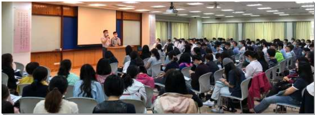
▲ 文山一區青職聖徒相調聚會

聚會首先安排青職聖徒按照四個主題分享蒙恩見證，依序是實行神命定之路、服事配搭、追求主話和彼此牧養。在實行神命定之路方面，有姊妹見證週週如何堅定持續外出傳福音探訪人。在服事配搭上，有青職聖徒操練配搭夜間擘餅和青少年服事。在追求主話上，有弟兄見證雖然生活忙碌，但仍抓緊通勤時間