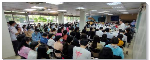
▲ 港湖大區青職聖徒婚姻座談

弟兄們總結的話提到，婚姻對許多人是愛情的墳墓，但真正幸福的婚姻有神聖的四要素：互相幫助、承受生命之恩、建立事奉的家、培育屬靈的兒女。願主得著更多愛祂並事奉祂的家。（郭詔安、王辰豪）