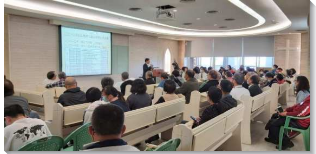
▲主日聚會中聖徒們喜樂相調交通

相調當天早上先有主日擘餅與召會生活見證分享，聚會中滿了弟兄們話語的勉勵，和召會生活馨香的見證。會後由三芝聖徒們豫備豐富周全的愛筵與服事。下午一時則進行校園福音講座，講座後再安排年長聖徒至醫學院附近的真愛森林步道有健走杖教學。眾人的甜美配搭和交通，見證兩地召會的同心合意！