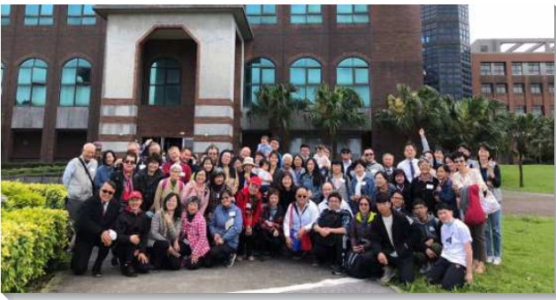
▲兩地聖徒於三芝馬偕醫學院相調

馬偕醫學院於二〇〇九年六月設立於新北市三芝區，共有三個學系和三個研究所，醫學院一年約有一百五十位學生，和馬偕護專三芝校區緊鄰而立。目前兩校學生聖徒有九位，尚未成立弟兄姊妹之家。學生服事也還在起初階段，非常需要由教職員、學生中幹、社區聖徒、負責弟兄與全時間服事者這五環來共同關心及配搭服事。此外，醫學院學生的醫學教育分為基礎與臨床兩階段。馬偕醫學院學生的基礎學習是在三芝的校園，而臨床端的學習就經由馬偕醫院淡水院區，進而到鄰近台北四會所的馬偕醫院台北院區。從三芝經淡水到台北，學生從基礎學習到臨床學習，橫跨新北與台北兩地，為使學生聖徒接受成全不間斷，便興起這兩地聖徒配搭相調的負擔。