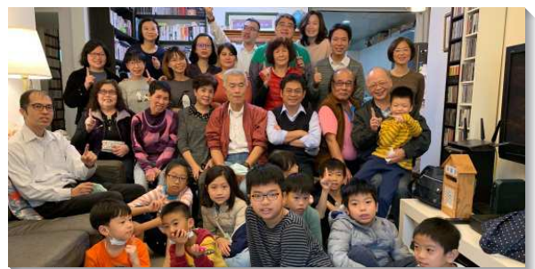
▲因應疫情改為線上聚集，召會生活不間斷

六月原是本會所表定的福音收割月，因著疫情，暫時不便為人施浸。但也因人心柔軟、外出行動受限，更是撒種、澆灌的好時機，我們豫計安排多場線上福音聚會。願聖徒們在此時期，藉著線上聚會，接觸更多人，抓住機會分享大好消息，把基督供應給人。(戴天楷)