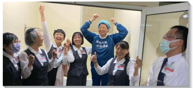
▲壯年班學員剛強開拓，喜樂帶人得救

高雄五甲青年人嚴重外移，年長者又多為偶像霸佔，但是學員和當地聖徒毫不氣餒，同心爭戰。左營居民對福音較為敞開，聖徒們更成立留守的禱告小組，一手建造，一手拿兵器。二隊共得了十三位新人。屏東此次開展麟洛、恆春、竹田、里港和東港五處，共得著四十一位新人。麟洛隊資源雖少卻鬥志高昂。八十歲的學員姊妹，全程保持喜樂的笑容，為人帶來心裏的舒爽，撒下生命的種子，盼望後日發芽結實。恆春隊不僅挨家挨戶叩門，探望久不聚會的聖徒，還至醫院的診間，傳福音給軟弱無助的人。竹田隊與青年班學員一同爭戰，青年人帶著吉他在夜市彈唱詩歌，吸引眾人目光，藉此也得著許多年輕人。里港隊有高雄、屏東、九如等地的聖徒一同扶持，眾人配搭如同四活物。東港召會聖徒人數雖少，但各個都是剛強戰士，在這偶像林立的鄉間傳揚國度的福音，毫無畏懼。