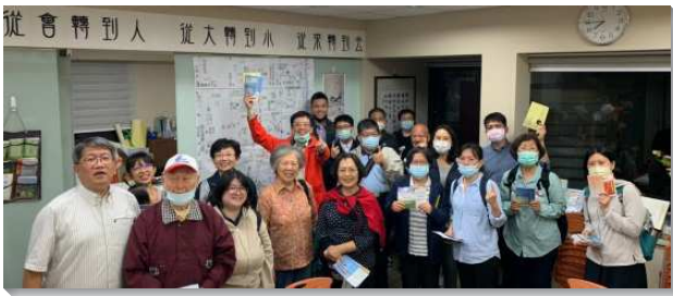
▲壯年班學員和聖徒配搭外出訪人

壯年班受訓學員於四月二十九日至五月二日至全各地開展。今年受疫情和乾旱缺水等影響，人心焦慮不安。然而，隨著壯年班福音開展行動，將神這活水湧流到各地，使信入祂的人流出活水江河。出發前，服事者期勉我們：一、要多多祈求，接受託付（路十二）；二、務要同心合意，彼此建造（腓二2）；三、要對人有深切的負擔，求主祝福（約十五16）；四、要憑靈而活，憑靈而行（加五25）。行前誓師大會上，眾學員靈裏焚燒，士氣高昂，紛紛宣告：『主阿！我在這裏，請差遣我。』（賽六8）。