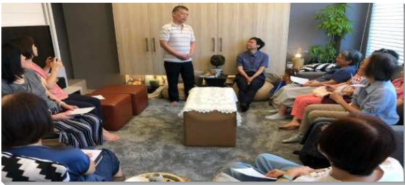
▲聖徒家打開，邀請親友同享主的筵席

十年前，姊妹買到了比她原先盼望還大的房子，她信這是主所成就的。她的先生及公公在這幾年因著與聖徒