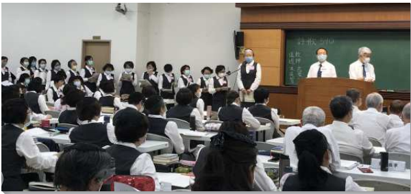
▲壯年班學員追求真理積極操練

本期壯年班畢業學員共有一百零四位，延伸訓練畢業學員三十三位。在疫情嚴峻的挑戰下，學員們經歷各種環境的變化，但藉著基督無限量豐富的供應，突破一切限制，使我們成為一班認識神的子民，仍能剛強行事！