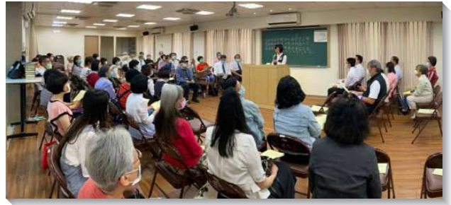
▲聖徒們與壯年班學員配搭傳揚福音

弟兄們帶領聖徒們，在週中會後仍堅定持續去接觸人。當第三級疫情管制開始，馬路福音改成線上福音座談，聖徒們積極配合青年班學員所安排一週五天的線上福音講座。每日皆有不同主題，一次三十分鐘，方便福音朋友加入。參與的聖徒每天都過得充實滿足，在主裏贖回光陰。帶領弟兄們吹起福音號角，聖徒則配合列出福音朋友名單並配搭福音行動，藉現代