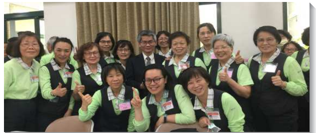
▲壯年班學員喜樂受成全

學員見證後，陸續頒發畢業證書及各種獎項。弟兄們勉勵畢業學員，在疫情受限的環境下，我們除了禱告求主管制疫情外，更該看見主來臨的重要兆頭，就是國度的福音要傳遍天下，對萬民作主的見證，末期才來到。目前台灣還有七十多處鄉鎮，亞洲還有十二個國家沒有主恢復的見證，盼望學員們看見全地的需要，領受負擔，投身在福音傳揚和移民開展行列中，使疫情的限制轉成眾人的救恩，在環境中轉向主、轉向福音、轉向對人的負擔，向主更新奉獻，將國度福音傳遍居人之地。