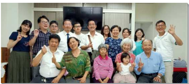
▲聖徒們喜樂配搭與主同工傳福音

主，高唱『西布倫出外可以歡喜，隨聖靈大風揚帆起行』。享受聖徒們豫備的早餐後，我們到富里與聖徒們追求李常受文集，裏外都得飽足後，再開始分組進行地毯式叩訪。或是陪人呼求，或是禱告祝福，在身體裏我們都能喜樂放膽，也留下不少敞開的名單。