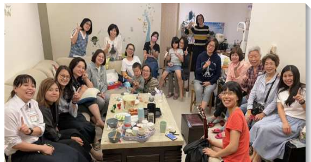
▲聖徒們同過喜樂甜美的召會生活

召會是祂的身體，是那在萬有中充滿萬有者的豐滿。因著主的愛，使我們的召會生活蒙保守、被堅固，聖徒們竭力追求主話，彼此相顧，相調在一起，彰顯基督榮耀的豐富。（林逸潔）