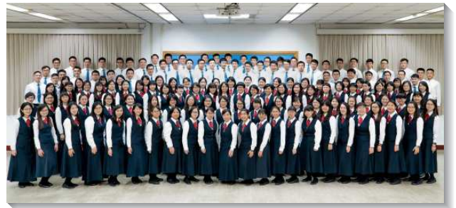
▲全時間學員參訓受多方成全

因著今年首次以線上的方式進行畢業聚會，學員們需在短時間內協力完成聚會影片的製作。眾人儘管受疫情的限制分散在各地，仍在一裏竭力配搭，照著身體的交通，合力將影片錄製完成。不同於一般實體聚