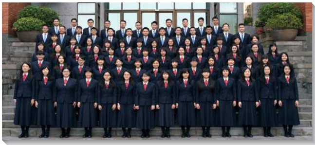
▲二〇二一年夏季全時間畢業學員合影

受全球性疫情的影響，訓練學員自五月中旬回到各地，以線上的方式持續訓練，在各處線上受訓實屬不易，處處受到限制，然而這卻給學員們一個絕佳的機會，憑著主的恩典，操練過照著神聖啟示高峰的生活，成為基督這第一位神人之生活模型的翻版與複製。我們一面感謝領受主所量的特殊情形，另一面我們渴慕藉著在各地實行神人的生活，產生基督身體的實際，建立起團體神人的模型，呼應此次畢業聚會及詩歌的主題—團體神人，極峰見證。