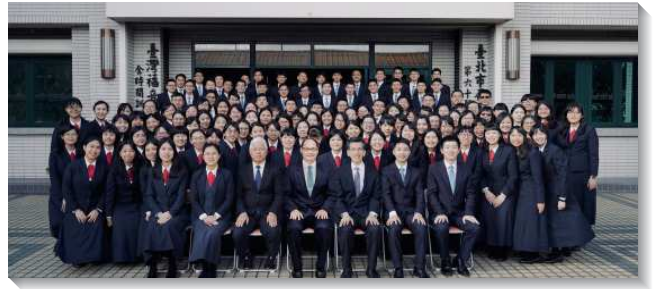
▲全時間學員完成兩年訓練

主是真正的施訓者，藉著兩年訓練將學員們從分散、單個的肢體，作成祂團體的彰顯。祂甄陶的手，帶領我們經歷生命細緻的變化。當我們與主的關係日益深摯，十字架的破碎也越趨深刻。在祂話的光照之下，我們天然的抓奪被暴露，隱藏的自傲受對付，卻