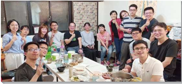
▲聖徒們在小排中相調彼此相顧

由於近年增區速度較快，各小區培養的中幹趕不上增區的速度，以致小排的豐富度略顯不足。因此去年起，我們陸續以大區的力量成立大專青職排及兒童