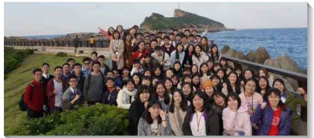
▲大安區大學生外出相調

聚會末了，弟兄更以『剛強壯膽、專一跟從、守住等次、不顧自己、緊緊跟隨』為總結來勉勵學生們。弟兄姊妹們也領受負擔，相約要在暑假期間，一同晨興、追求真理，為夏季訓練作準備，同時也為福音朋友、同學列名禱告。盼望學生們更寶愛神的話，主的話能繼續擴展，福音的火不斷焚燒，人人豫備好在新學期要在各校園為真理作見證。（游睿瀚）