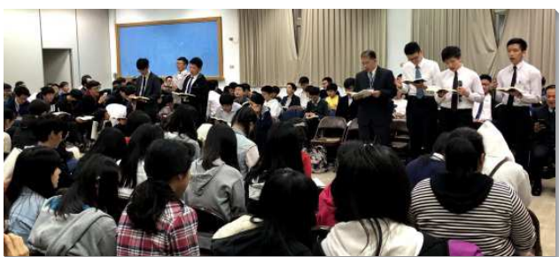
▲城中大同區青少年聖徒聚集

主日早上，城中、大同和萬華分三個照顧區先有擘餅聚會，再帶領學生們進入以科學傳福音的信息，鼓勵眾人在暑期抓住機會，與主配合，用現代科技傳揚福音。願主祝福這些話語，能在學生們裏面繼續擴展，使他們個個都成為耶穌瘋狂的愛人。（李秉謙）