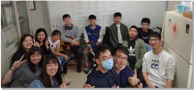
▲政大學生的校園小排繁增

已過這一學年，在身體的交通中，弟兄們積極鼓勵政大學生們在校園裏剛強開拓，實行增排開展。在二〇二〇年六月到九月，校園中從原有兩個小排繁增為四個小排。到了今年三月，更繁增為六個小排。學生們的負擔是在各個學院都有主的見證人，為主發光發