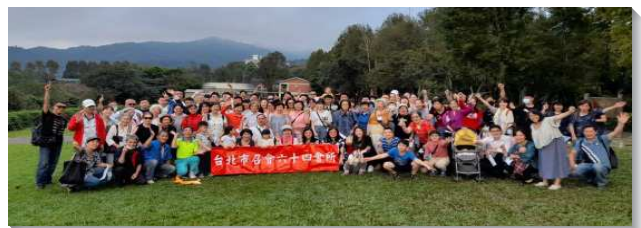
▲聖徒們同過豐富的召會生活

感謝主，召會生活不是聚會化乃是生活化，雖然目前召會實體聚會受到疫情打岔，但是主的靈衝破一切限制，聖徒們在靈裏仍然享受基督的豐富，在靈裏自由無比。我們一面希望疫情能儘快受控制，早日恢復正常運作；另一面在疫情期間，我們更要把握機會，更多與聖徒們一同享受基督，經歷基督的闊、長、高、深，使我們在身體同被建造。 (林晨希)