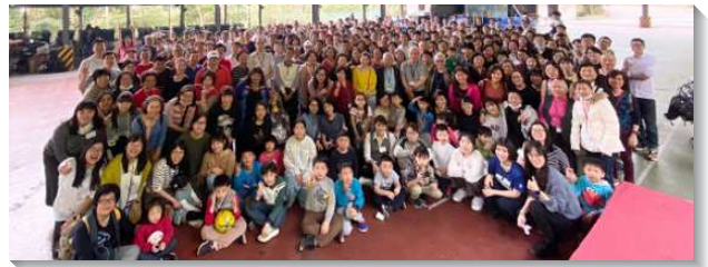
▲聖徒們同心合意積極實行神定之路

原有的召會生活、傳福音的方式雖因著疫情改變，但我們仍繼續實行神命定之路，並緊緊跟隨耶和華軍隊的元帥，祂與我們同在，也為我們爭戰，我們信靠神已將祂所應許的美地賜給祂的召會！（王佳美）