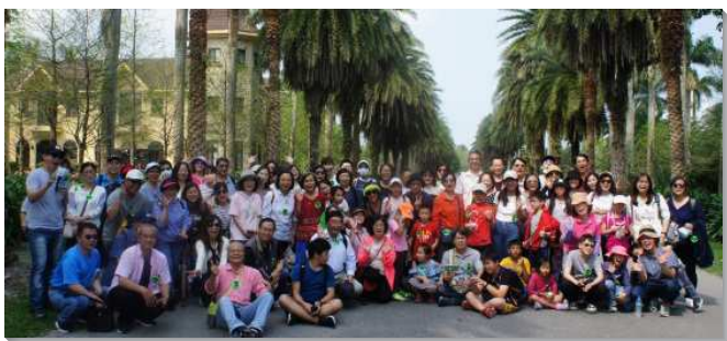
▲聖徒們在愛中彼此相顧，一同隨主往前

的關鍵就是鼓勵大家開始使用網路的聚會軟體。雖然在實際的情形裏，年長聖徒不善使用軟體需要幫助，然而青職的弟兄姊妹們都積極的探訪一位位年長聖徒，協助安裝聚會軟體，並且以最簡易的方式教學，使每位聖徒都能殼上線享受身體的豐富，務要排除因不熟悉所造成的為難而想放棄我們自己的聚集。有了對於疫情的初步應對後，大多數聖徒均能參與線上的聚集。這樣的肢體彼此相顧、互相關切，何等甜美！