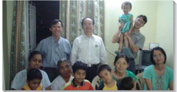
▲弟兄看望在印度的聖徒們

記得有次和弟兄一同至印度最南端的一個小漁村 Kanyakumari 看望聖徒，當地常聚會的聖徒多為姊妹，因為男性多出海從事漁業，長年不在家。當我們去看望時，當地服事的弟兄請我和姊妹們分享主話的豐富，我們在會所席地而坐，環顧四週，有十多位姊妹，其中較長者如同我母親的年齡。當時我心想，我