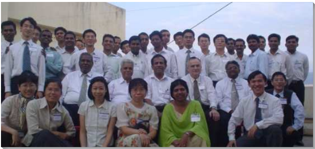
▲在印度的聖徒們喜樂相調

在我參加訓練時，海外開展的心願才慢慢萌芽。在訓練中心，我們觀看『敞開的窗戶』Open Windows 的影片，每集有不同信心的榜樣和見證，非常激勵人。有一集的主題是『當前青年人的異象』，我特別受感動，影片中記錄許多西教士因為聖靈的工作而被主呼召至遙遠的中國傳福音的見證。誠如二、三世紀時北非教父特土良（Tertullian）所說的：『殉道者的血，是教會的種子』，他們受感並願意與主配合，將福音與真理帶到中國。當時我們亦進入『一個新人』的信息，我在禱告中祈求主給我看見這異象，也給我這樣的實際和經歷，我也為著主在我心裏所種下的海外開展的種子和心願有尋求與奉獻。