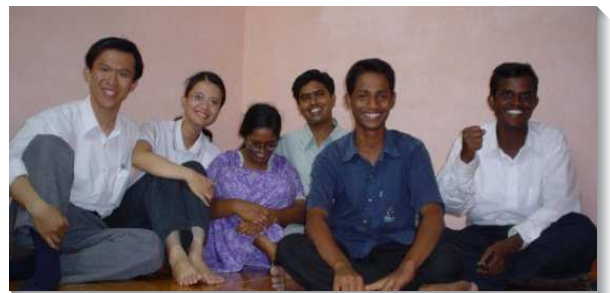
▲聖徒們顧惜牧養新人

我和弟兄也配搭全時間訓練中心的服事，常經歷到『惟有基督是一切，又在一切之內』。服事訓練對我們而言是很大的一個挑戰，面對印度人文化、語言、習慣上的差異，叫我們學習不以自己為人位，只以祂為我們獨一的人位。這裏的學員們在主恢復裏的年日，都不太長，因此在我們的服事中，一切的成全和幫助都必須從頭開始，一面需要維持訓練該有的標準，一面仍要將他們當作新人來顧惜和餵養。