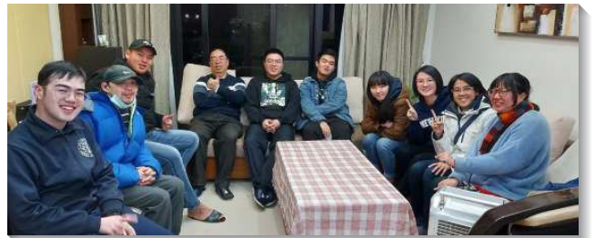
▲聖徒們堅定持續彼此牧養

的果效就顯出來。六位久未聚會的聖徒被恢復，線上的聚會除去距離的問題，我們平時的牧養讓他們進入聚會時不覺得陌生，而能自然的和弟兄姊妹相調。