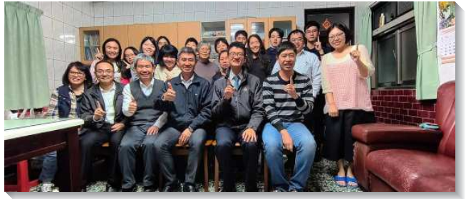
▲聖徒們至嘉義溪口配搭開展探訪

並且也缺少年輕的家。他們竭力的服事成為我們的榜樣，使我們得激勵再奉獻給主，渴慕有分主的行動。