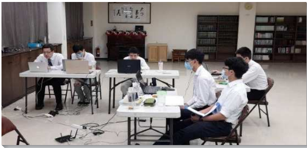
▲ 青年聖徒擔負路加集調線上的服事

這次全台路加集調由竹苗大區服事，原本安排規劃至苗栗的渡假村聚集，但從五月份開始，因著新冠疫情，聚會有許多的限制，服事配搭的弟兄們經過多次