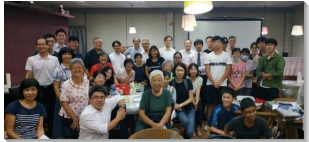
▲ 五環聖徒們配搭校園服事

經過多年的路加集調，路加聖徒逐漸凝聚了集調的四大主軸：培育在校園、牧養在職場、配搭在召會、行動在全地。每年也會依據召會的水流擬定主題，今年