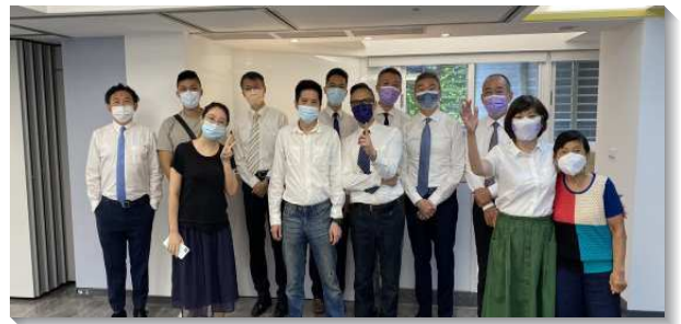
▲聖徒們同心合意過召會生活

在這樣的實行中，我們發現與實體聚會相較，線上聚會更能邀約人一同參與。本會所在六、七月份平均主日人數增加四十六位，全會所繁增率為百分之四十五以上。青年人部分，大專生繁增百分之四十，青職繁增百分之三十五，中學生繁增百分之四十八。真是印證了弟兄們的交通：只要我們願意照著聖經、照著職事的帶領實行神命定之路，就有蒙恩。