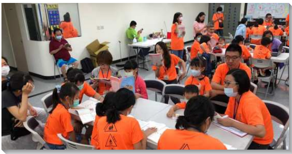
▲聖徒們一起配搭親子健康生活園

兒童也只有十位左右。然而家長們都願意實行聖經中所說的，『讓小孩子到主這裏來』，並且盼望落實職事信息所交通的負擔：『兒童是大的福音』，『得兒童就得家長』，『得著兒童就得著兒童的一生』。因此，兒童服事者尋求在禱告聚會時與聖徒們交通，並傳輸負擔使眾聖徒都能為本次親子健康生活園禱告。