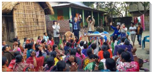
▲ 路加聖徒至海外配搭開展

配搭在召會方面，今年安排了五個移民鄉鎮開展召會的見證。台灣有八十個鄉鎮沒有召會的見證，更有為數不少的召會人數不多，照著使徒行傳傳福音有耶路撒冷的路線，需要移民才能開展成功。路加聖徒在鄉鎮就職機會多，應該成為台灣福音化的先鋒。