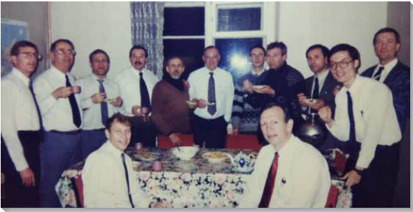
▲在聖彼得堡的弟兄們交通享用茶點

一九九七年在我受訓第二年將結束時，我報名海外開展，弟兄們也接受了，但一開始原是分派我到羅馬尼亞開展，我也和隊友積極準備。然而很快的又被通知，等我結訓後結了婚，就和姊妹去俄國開展。其