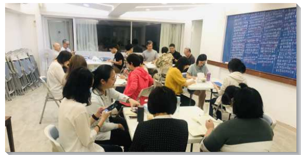
▲聖徒們參加晨興聖言追求小排

有聖徒分享，為要回答問題，需要認真研讀晨興聖言信息。在會中大家分享個人的摸著和經歷，更藉著弟兄們的重點提示和負擔加強，就能對其中的真理有更深的認識，原先不明白之處都獲得解答，而得到極大的蒙恩。有聖徒為著選題作答，更加看重與同伴的晨興，每早認真研讀晨興聖言。因著這樣的操練，屬靈生命有顯著的成長，也越來越渴慕追求主的話。