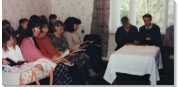
▲聖徒們參加主日擘餅聚會

聖彼得堡是我和姊妹新婚後的第一站，在那裏大約九個月左右的時間。我們被安排在一戶作為聚會場地的公寓住宿，當地的人稱這樣的公寓為三房，但事實上其中一房是客廳。然而我們大部分的聚會都不在客廳，因為它不彀大，反而是三房中最大的一間作為聚會場地。我們被安排在當時召會的第四小區，所以小區的禱告聚會、主日聚會都在我家，每週有二到三次的全時間交通、週週召會的負責弟兄聚會、學生的小排聚會（可能還有其他聚會，已不太記得），也都在我家。弟兄聚會要準備茶點，主日聚會後要有飯食。當時的我覺得何等喜樂，而我的姊妹除了喜樂之餘，自然是覺得體力不堪負荷。如今看來，實在不知我們怎能這樣服事，或許這就是保羅在林前十五章十節說的，『但這不是我，乃是神的恩與我同在』。