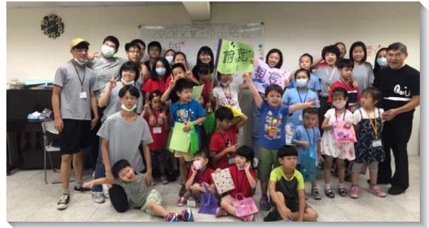
▲聖徒們配搭親子健康生活園

服事者在活動前先提供聖經人物故事的音檔，請家長帶著孩子配合繪本先豫習。活動當天播放影片，帶孩子們認識大衛的剛、柔、順性格。線上問答則溫習故事內容及課程主旨，讓孩子們學會尊重他人。最後進入配合每週主題設計的闖關遊戲，事先要熟讀聖經節以完成活動，在有限時間內穿戴好『神全副的軍裝』。各家在隊輔的幫助下，完成了親子珍賞、話溫柔的『珍賞牆』。更在快問快答中學會在生活中操練尊重人並順服神。