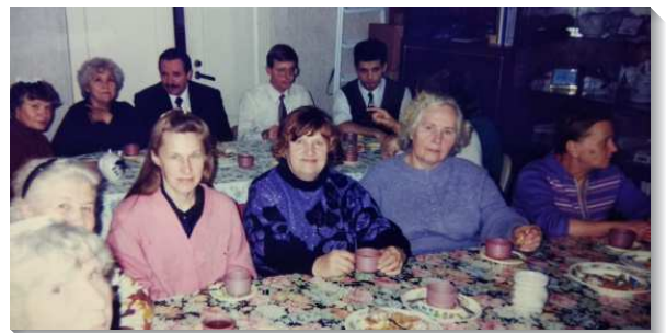
▲聖徒們一同聚集交通

一次讓我到永世都印象深刻的經歷，就是在我們剛到當地之後要辦夏季錄影訓練，那時聖彼得堡已開始下雪。在全時間交通中分配各項服事，我被分配要帶著放在我住處的錄影帶播放機到訓練場地。然而訓練的第一天，我和姊妹很喜樂的出門，到了訓練場地時，弟兄發現我並沒有帶播放機，我除了羞愧之外還非常自責，趕緊帶著幫我們翻譯的先生，叫著車回到住處拿播放機。第一堂聚會因此被耽延了半小時，這使我非常愧疚，也非常沮喪。會後，弟兄們聚集交通檢討，我為著我的一時疏忽，實在難過到無言以對。