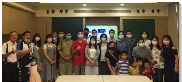
▲聖徒們喜樂過召會生活

以前弟兄姊妹們題到四十八會所，都會說：四十八會所是全台北最小的會所，是便雅憫支派，聖徒人數較少。但現今，我們不是最小，而是最『新』。新人多、青年人多、幼童多。聖徒與青職比例一比一，聖徒與幼童比例五比一。感謝主！（宋子猷、王辰豪）