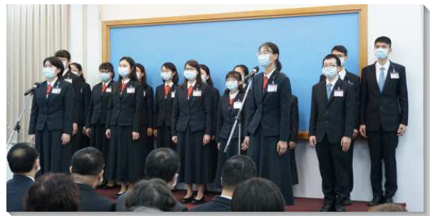
▲訓練學員感謝家人的扶持

一位學員的父母見證訓練在他們女兒身上的製作，姊妹的家人見證她在神命定之路上的蒙恩，從原本較膽怯的個性，成爲了爲神權益站住的人，爲福音火熱而不顧自己臉面和需要，並與家人一同分享帶人得救的喜樂，使家人同受激勵。未了的福音信息，弟兄藉深入淺出的方式，再次說明訓練的獨到之處，並向親友解釋靈、魂、體的區別，並以撒迦利亞書十二章一節說，『鋪張諸天、建立地基、造人裏面之靈的耶和華』，說明『人的靈』是如何等與天地並重的，鼓勵眾人一同運用靈呼求主名。願人人都能看見參加全時間訓練絕非枉費，乃是最上好的選擇，也盼望這美好的祝福不只臨及學員們，更能臨及每一位未得救的親友！