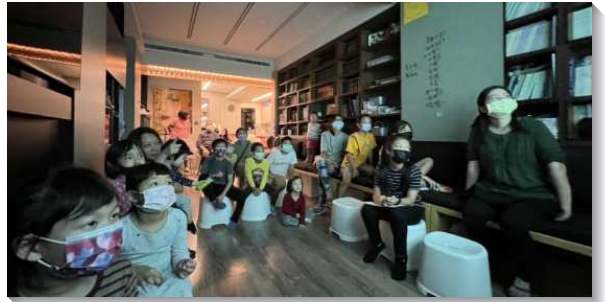
▲親子參與暑期線上福音活動

線上福音結束後，我們統計，幾乎所有的場次都可以達到七十人以上，最多甚至可以達到二百人以上，