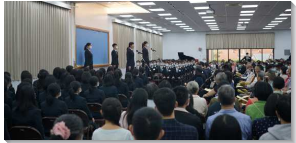
▲訓練學員向眾人分享見證

另有六位學員分享在已過訓練所受的幫助，包含在真理、生命、事奉、基督的身體、性格和心志方面的蒙恩，見證訓練的成全是幫助學員成爲一個各面平衡的基督徒。一位姊妹分享，原先她在職場和召會生活中若遇到爲難的環境，總是忍耐，安慰自己這是主要藉著環境來成全，但卻使她滿了苦味，但經由教師的開啓，看見出埃及記十五章二十五節的圖畫『摩西把樹，丟在苦水裏，水就變甜了。』姊妹認識醫治苦水的樹就是基督的十字架，並學習在禱告中聯於基督的十字架，雖然環境