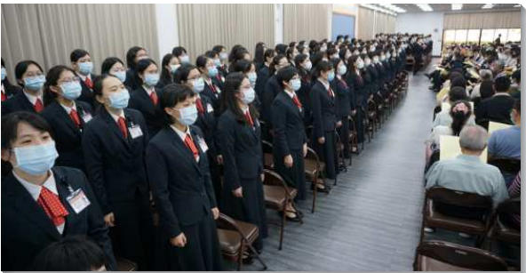
▲全時間訓練家長開放日在三會所舉行

聚會正式開始前，學員們引導眾人至各樓層參觀訓練中心，有寢室內務展示、訓練沿革歷史，以及歷代海外開展簡介等。藉著這樣導覽，展示學員所過之規律且正確的生活，作與這彎曲悖謬世代相反的見證。學員們臉上洋溢著喜樂，使人看出真有一位活動的神是按著祂的美意在學員們裏面運行。