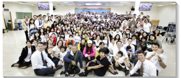
▲五十九會所聖徒們同心走神命定之路

二〇一五年元月四日，五十九會所自四十三會所增出。藉著增會所，負責弟兄們在文山二、三大區共同帶領下，堅定走神命定之路，注重經營健康的召會生活生態，及重新健全的召會事奉架構，鼓勵人人盡功用，家家都打開，組組動起來，區區都增區，並強調落實四大屬靈工程—晨晨復興、追求真理、探訪關懷、彼此代