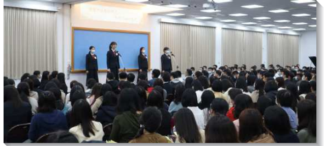
▲全時間訓練學員分享參訓蒙恩

接著學員們分享他們蒙神呼召參加訓練的見證，以及在訓練中所受各方面成全的蒙恩。一位學員分享希伯來書十一章二十六節說到，摩西『算為基督受的凌辱，比埃及的財物更寶貴，因他望斷以及於那賞