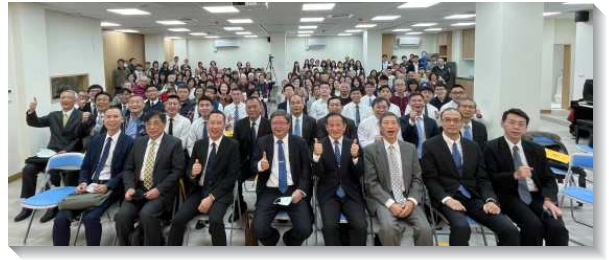
▲八十四會所於二〇二一年十二月十二日成立

聚會亦邀請信基大區各會所弟兄們前來參與並鼓勵。新購買的八十四會所，靠近台北醫學大學，雖位於地下室，但通風良好、不擾鄰、空間寬敞。可供四十和八十四會所集中，以及分區聚會使用。八十四會所成立於主恢復來到一百年之際，頗具意義。說出這些年主在祂的