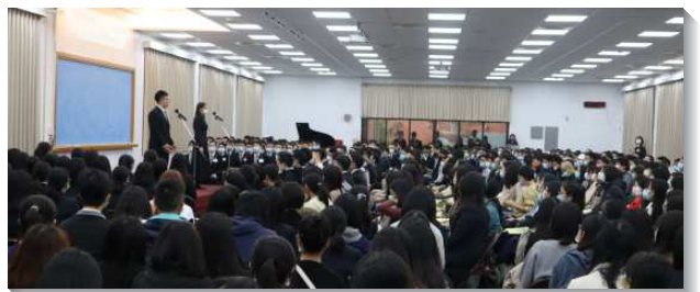
▲全時間訓練學員見證受主的成全

末了，教師交通到神聖的生命要長大，成熟，並且盡功用，非常需要受訓練。我們或許認為喫喝享受主，就會長大並盡功用，然而喫喝享受是否有規律，是否成為習慣才是最重要的。全時間訓練提供長期的、生活的、完整的訓練，在八方面成全學員，並有絕佳的環境與最有心願事奉主的同伴，一同在這職事下受訓練。