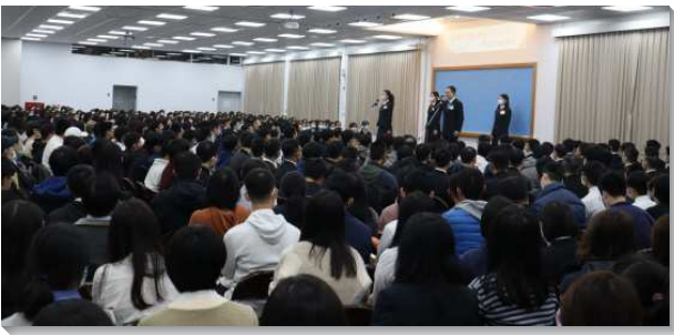
▲全時間訓練呼召聚會在三會所舉行

本次呼召聚會的主題是『與奮力活動的神是一，寫神今日的歷史』。從全本聖經我們看見，神子民在地上的歷史，事實上就是作工的神在祂選民中間奮力活動的歷史，甚至是運行的神在祂贖民裏奮力活動的歷史，使他們與祂一起奮力活動，為著完成神對基督和祂擴增的永遠經綸，並且要終極完成於新耶路撒冷。