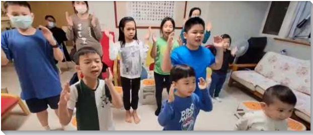
▲ 兒童們喜樂參加暑期線上視訊活動

七十九會所於去年暑期七月十一日至八月二十九日，每週舉辦二場兒童線上視訊活動，以開拓兒童接觸對象。每場次約四十分鐘，共有十八場兒童活動。參加活動的兒童，最高曾達六十位。因著家長也會陪同參加，當週召會生活人數達到二百四十二位，高於平均約四十位左右。藉著兒童開拓社區福音，不僅得兒童也得著家長。暑期線上兒童活動期間，平均每週兒童排的人數約五十位，佔召會生活平均人數約百分之二十，比平時多了百分之五。讚美主。