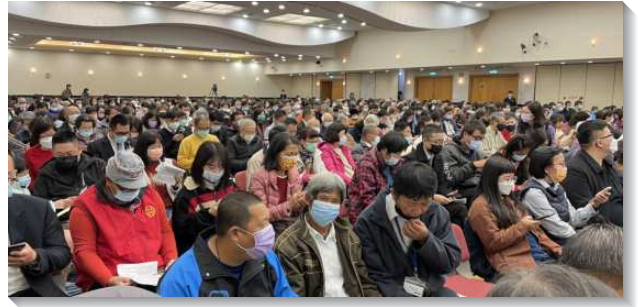
▲聖徒們參加信基大區集中主日聚會

弟兄特別點出『聖經中心的事乃是神聖的經綸連同神聖三一之神聖分賜，要分賜到在基督裏的信徒裏面，為著建造召會作基督的身體，終極完成於新耶路撒冷，作三一神永遠、團體的彰顯』。神是有經綸的神，神不單只是有能力應付人的需要，更是有計畫、有章程。我們人常是有章程，何況是神。因此，我們應該看見聖經中心的事，就是神聖的經綸。『經綸』可以繙成計畫、章