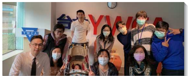
▲ 聖徒們一同配搭職場排

願我們繼續在這排中與主配合，堅定持續供應主的話，讓主不僅是這個職場排的創始者，更是成終者，在這職場排中結出果子來榮耀神。（施多加、葉恩揚）