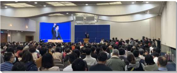
▲信基大區聖徒們參加集中主日聚會

當日信基大樓現場到會有：大人七百一十八人，兒童三十三人，其中包含了五會所、六會所、十六會所、三十四會所、六十九會所、八十會所，還特別邀請信基大區聖徒之前至二崙配搭福音開展帶得救的新人，和崙背及西螺的聖徒們前來。副會場分別在七會所場地，有七會所同五十二會所，另在四十一會所有四十一會所同七十二會所聖徒，藉著線上同步參加信基大樓主會場的直播。擘餅聚會後，眾人一同進入感恩節特會信息的負擔，並且有全時間訓練學員的展覽，以及參訓的蒙恩。