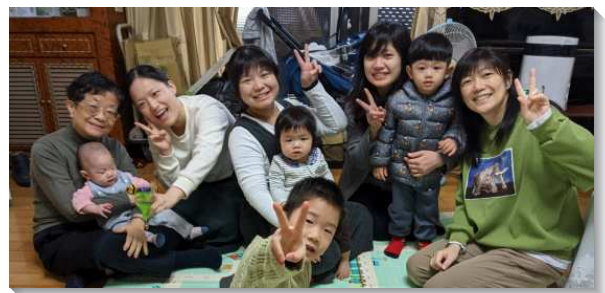
▲親子們參加兒童幼幼排

姊妹們在小排中分享育兒經歷，看見媽媽們能同聚在一起真是出了代價。媽媽們彼此有配搭一起禱告、追求，就很輕省，在身體的配搭中真是喜樂。主是葡萄樹，我們是枝子，離了主，我們就不能作甚麼（約十五5）。願我們一直住在祂裏面，一面接受供應，一面受主的修剪而多結果子，成爲主的擴增。（楊洪玄妙）