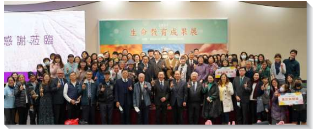
▲ 二〇二一年得榮基金會生命教育成果展

上學期因疫情無法舉辦實體公服，但關懷者們絞盡腦汁，讓得榮少年在無法見面的情況下完成公共服務。例如舉辦線上兒童活動，讓少年們參與事前規劃、帶領活動等。疫情降級後，有些志工團則帶領得榮少年走出戶外，至鄰近公園撿拾垃圾、維護環境。