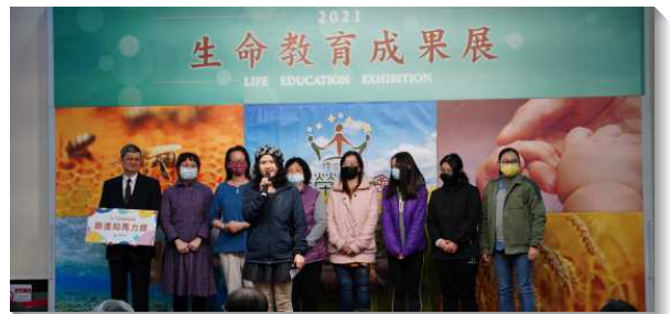
▲ 志工團服事者分享見證

今年初新開辦的PHL兒童合唱團，邀請到曾獲得國際比賽金牌獎的指揮老師帶領兒童，希望讓孩子們在歌唱中感受到自信、快樂，也培養團隊合作默契。