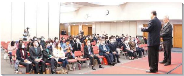
▲ 聖徒們參加生命教育成果展

去年五月疫情重創全台時，基金會迫切感受到教育資源落差的急遽擴大。在疫情發布三級警戒後，許多家庭的經濟受疫情影響，陷入困境。為了幫助有需要的青少年，得榮少年獎助學金申請範圍除了台北、新北及桃園、中壢等地有九十八位得榮少年，更擴展至全台，在中南部新增六處關懷據點，共新增四十七位學生，分別來自新竹橫山、台中太平、豐原、嘉義番路、屏東東港、枋寮。每年五月為得榮少年教育專案申請期間，今年全台共一百四十五位學生接受基金會獎助學金幫助。