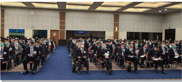
▲ 聖徒們參加冬季訓練暨禱研背講聚會

第二篇信息是『哈拿的職事』。在以利之下的老舊亞倫祭司體系變得陳腐、衰微，就著祭司職分而言，神是貧窮的，渴望有一個新的起頭，爲此神迫使哈拿禱告，求一個男孩子，她的禱告回應並說出神的心願，是人與神行動的合作，以產生撒母耳轉移時代。這樣帶進君王和國度的職事，就是哈拿的職事。