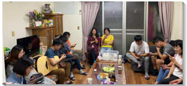
▲聖徒們於青職排中喜樂聚集

藉著週週喫喝享受主，有些青職聖徒邀請同事來到青職排中，並在小排中傳揚福音，到去年底已帶進六位青職得救。感謝主，藉著週週堅定持續實行活力排，使社區聖徒及青職聖徒都滿了活力，並在召會中成為活而盡功用的肢體。願主在今年得著更多青年人起來承接託付，有分基督身體的建造。（陳正杰、陳楊婉玲）