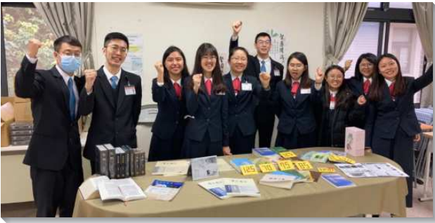
▲訓練學員至全台各地書報推廣

一、接受負擔，學習傳佈真理－保羅在提摩太前書二章四節說，『祂願意萬人得救，並且完全認識真理。』主的恢復所要恢復的，就是真理。神的工作在地上所以能往前，都是藉著祂的話語。特別是從倪柝