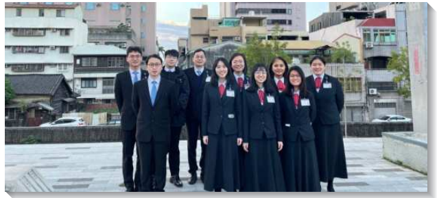
▲訓練學員至台中地區推廣書報

在拜訪會堂的過程中，學員看見自己的裝備不足，但在身體的配搭裏，我們便能一間一間放膽的叩訪，