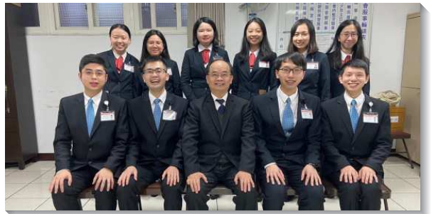
▲訓練學員至桃園地區推廣書報

在過程中，我們也經歷禱告調靈，使我們同靈同魂，為著信仰一齊努力。越禱告，我們越不依靠自己，只依靠主。彀多的禱告使我們得以同心合意，並且滿了衝擊力。我們不僅為自己禱告，為同伴禱告，更為著訪問的會堂與聖徒禱告，求主興起更多愛祂、尋求祂話語的聖徒。感謝主，無論在那個會堂，總有人渴慕主話、付代價買真理。如同詩篇一百一十九篇一百三十節所說，『你的言語一解開，就發出亮光，使愚蒙人通達』。