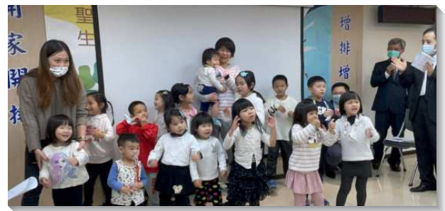
▲兒童們於年終數算主恩聚會中展覽詩歌

令人印象至深的是，去年五月新冠肺炎疫情使許多地區升為三級警戒，聚會從實體立刻轉到線上，我們擔心召會生活會被打岔，無法往前。感謝基督身體的供應，六月中旬文山大區的見證加強了我們一新酒要裝在新皮袋裏。藉著過攻勢的召會生活，主日人數於六月達一百