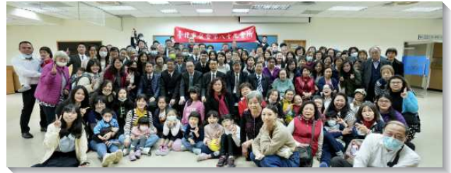
▲八十七暨八十九會所於二〇二一年十二月十二日成立

二〇一二年，十三會所人數繁增到九百五十四位，增出四十三會所（十三會所主日人數五百二十九位，四十三會所主日人數四百二十五位）。至二〇一五年，十三會所人數繁增到六百七十七位，再增出五十三會所（其中三百四十位聖徒，至五十三會所）。在神的祝福之下，也購置了景美街一號的會場，離景美捷運站二號出口僅一分鐘路程，鄰近景美夜市，附近人文生態、生機