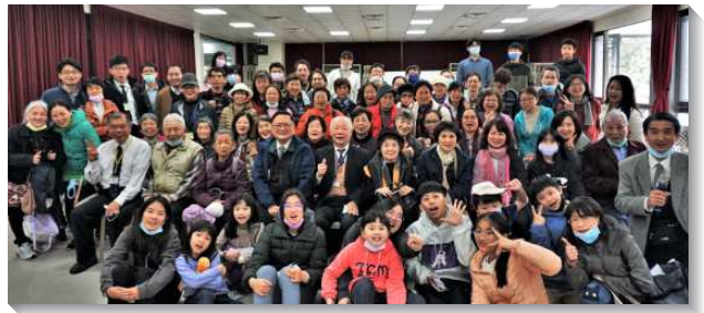
▲聖徒們參加年終數算主恩聚會

一月八日，核心的聖徒們再與七十會所的負責弟兄們共進早餐，眾人為著今年的目標一同禱告、交通。願主七倍加強的靈加強聖徒們，靠主堅定持續、勞苦奮鬥的實行『屬靈一、二、三』，就是每週至少愛筵聖徒或福音朋友一次、看望兩個家、打三通電話顧惜人。盼眾人藉此與神合作，實行生機牧養以建造召會。（蘇聖彰）