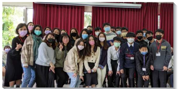
▲青少年喜樂成長盡功用

除了週週出外訪人傳揚福音外，每年春、秋二季的『學生福音日』，也是傳福音的重點。如此不但加強了青少年傳揚福音的負擔，也使學生們有機會在真理、牧養及服事上多受成全與操練。已過去年四月的學生福音日共有四十九位參加，其中福音朋友就佔了十一位。去年十二月的學生福音日以及今年的寒假特會，都再次邀約這些福音朋友們同來相調，盼望藉此使他們認識基督身體生活的榮美，讓福音朋友們能早日受浸，並成爲常存的果子。（沈建中、沈張紓）