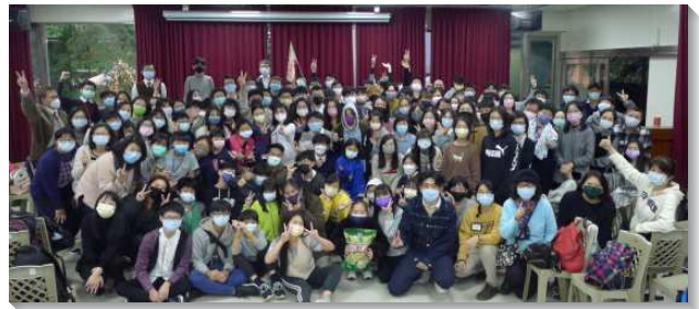
▲ 港湖區青少年寒假特會

弟兄交通到這彎曲悖謬的世代需要結束，藉著彰顯基督的召會帶進國度，所以神就需要『男孩子』。哈拿的職事叫我們看見，我們的禱告乃要聯於神的需要，而禱告的結果就是產生『男孩子—得勝者』，轉移這個時代。我們也需要從撒母耳身上學生命的功課，停留在神