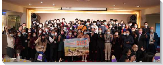
▲得榮少年們獲頒獎助學金

高中三年級的同學說，她成為得榮少年的改變有三個點：第一，會照顧年紀小的少年；第二，樂於助人；第三，時時心存感恩。她也很感謝關懷者，特別在她心情不好時，都用神的話來鼓勵她。因著受到得榮基金會諸多的幫助，她期望畢業後就讀大學時，能回到得榮基金會擔任大學志工，幫助更多青少年。