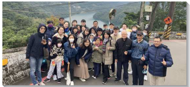
▲聖徒們與國防醫學院學生出外相調

真理構成也受成全。末了，也有禱讀的操練，或為著彼此的情形代禱，這使我們在主裏調和為一。當我們建立每天固定的晚禱生活時，主就把果子加給我們。原本的聚集有四位弟兄和一位小羊，和三位福音朋友，至終兩位得救了，成為神家裏的親人。姊妹們也藉著陪同學家聚會，積極擺上自己的一份，見證聖靈的水流在我們中間湧流。藉由平日的經營與勞苦，兩位同學也在家聚會中，受聖靈感動而歸入主名，激勵我們繼續為人在主裏生命長大，一同竭力奮鬥，盼望他們成為常存的果子。