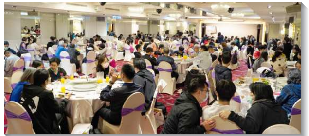
▲得榮少年及家長和關懷者參加頒獎餐會

接著頒發得榮少年獎助學金，本學期共九十六位得榮少年獲頒獎助學金，雙北地區有四十九位得榮少年出席餐會。其中桃園區有二十二名少年獲獎，然而考量疫情，未邀請他們出席當日餐會，改由基金會執行長及同仁將獎助學金支票、禮物，事先請關懷者們轉交。其後是Happy Learning頒獎時段，由得榮基金會和恩慈基金會合辦的快樂學習，已完成第十七期課程，本次共十四位學生和四位關懷者獲得全勤獎。