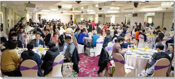
▲得榮基金會獎助學金頒獎餐會

同時為縮短聚集時間，基金會將頒獎聚會部分環節移至用餐時段，有得榮少年公服影片、事先錄製的少年感言、Happy Learning快樂學習成果影片、得榮生命教育體驗營成果影片，讓大家一邊用餐一邊觀賞。