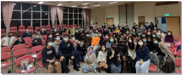
▲城中大同區青少年寒假生活園在四會所舉行

來自十七個會所，自願奉獻的青少年們，分別四天的寒假與同伴們一同操練靈，禱告接觸主。不同會所的學生們分組進入撒母耳記的經文及信息，使青少年們看見哈拿禱告的職事，以及撒母耳事奉神的榜樣。小組追求結束後有各組展覽，大學服事者們率先操練背經，國中生甚至小五、小六的青少年都突破個性上