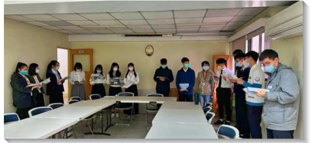
▲大學聖徒分組禱研背講信息

作基督身體之生機的建造，藉著基督建造到我們內在的構成，有屬靈新陳代謝的過程，照著信徒對內住基督的內裏經歷，建造召會作基督的身體。第十篇陳明我們就是米非波設，享受神的恩慈，與祂一同坐席，因著神的恩慈，我們要以恩慈相待，也該心存慈憐，彼此饒恕。