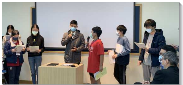
▲信基大區青少年寒假特會在八十四會所舉行

特會末了發給青少年們在寒假期間操練每日讀經、背經的進度。寒假過後有三十位青少年完成進度，他們都見證因著天天操練背聖經，而在寒假贖回光陰，並與同伴建立共同追求主話的習慣。（楊立誠、陳一靈）