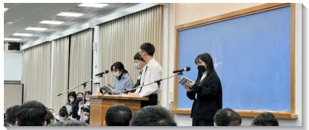
▲大學聖徒在冬季現場訓練中踴躍分享

第十二篇從撒母耳記裏五個主要人物，以利、撒母耳、約拿單、掃羅和大衛，說到關於在美地上享受美地之屬靈的原則、生命的功課，以及聖別的警告，以兩個積極的人物榜樣及三個消極的榜樣作為結語。