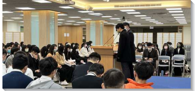
▲大學聖徒在期初特會中服事詩歌

文山一大區：期初特會的負擔說到，神福音的中心是神人基督耶穌。學生們摸著福音不只是一個行動，