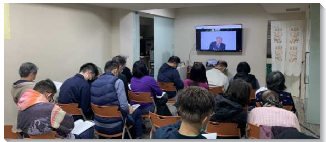
▲聖徒們於清早參加冬季訓練禱研背講

聖徒們也因著在排聚集裏彼此教導神聖的真理，有越來越多人有分於一年七次的職事說話。首先，聖徒至中部相調中心參加國殤節、感恩節特會禱研背講的人數增加了一倍。此外，在冬、夏季訓練前，有分於速讀該卷聖經本文的聖徒也越來越多，佔參加現場訓練的三分之二。再者，本次冬季訓練參加禱研背講的聖徒人數，十二篇平均起來，較去年增加九位，含六位青職聖徒，其中有相當激勵人的見證。