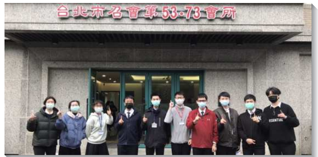
▲各區大學聖徒參加期初特會

大同大區：在最後一篇信息的末了，弟兄題醒學生們，需要成爲在生命中作王，並爲著基督身體生活而活的人，因此必須在團體生活裏操練四個點：第一，彼此珍賞，常常看見別人的優點；第二，不要定罪對方；第三，要彼此牧養；第四，彼此相愛。藉由真理的開啓，學生們將這些點帶到所在的校園、召會生活中，與同伴一同操練實行。這樣的生活不只是帶進學生在生命中彼此調和爲一，更是過一個不以福音爲恥、放膽傳揚福音，並多結果子的生活。