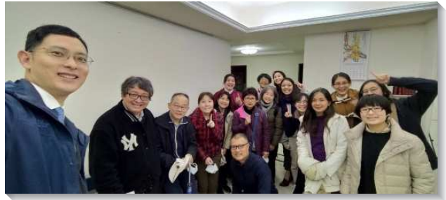
▲聖徒們一同出外叩訪傳福音

學員開訓後，我們仍繼續鼓勵聖徒週週分別一個時段，一同外出傳福音，無論是在街上傳或是叩門，我們總要出去接觸人，把國度的福音傳遍主所量給我們的地界。弟兄姊妹福音的靈，也因著堅定持續的出訪