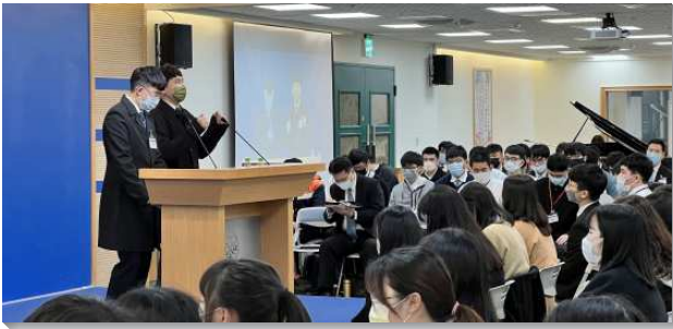
▲大學聖徒期初特會在萬芳會場舉行

本次特會的總題是『羅馬書中神的福音』。神福音的中心就是神人耶穌基督，祂兼有神性與人性，祂是神的獨生子，也是神的長子。神要以祂這兼有神人二性的長子基督，為生產者，為原型與模型，產生祂的眾子，就是我們這些信而接受祂兒子的人，這也是我們所傳高品的福音。我們要向人傳揚福音，首先需要不以福音為恥。講說福音是光榮的，如果沒有勝過這個羞恥感，我們的傳講就沒有用處。第二，我們需要