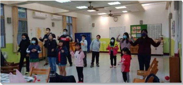
▲聖徒們至鳳林開展並配搭兒童服事

與配搭，原先規劃許多實行方法，後來藉著與同伴交通禱告，經歷到事奉乃是神起頭而不是人起頭。聖徒們也在配搭及陪伴兒童的過程中看見兒童的簡單與單純，彷彿自己也回轉像孩童。兒童排結束後有愛筵，則由兩位弟兄服事飯食，人人都盡上生機的功用。