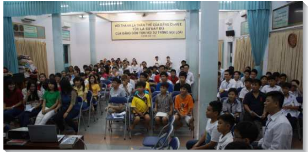
▲在越南的青少年特會

後來為著加快語文的學習及孩子的上學，我們搬到越南最大城市—胡志明市，那裏約有四百位聖徒，分為八個區在聖徒家中聚會。白天我到大學學習越文，下午和