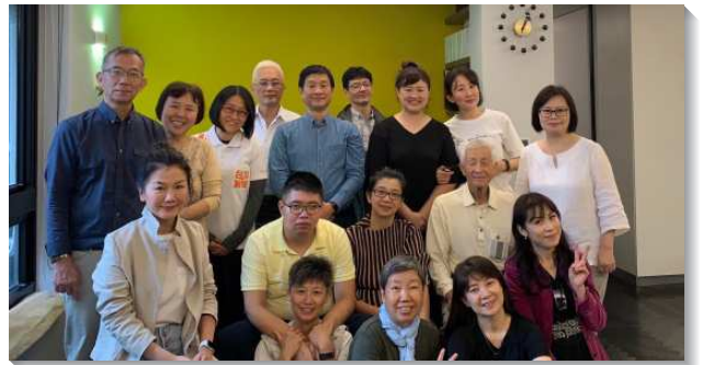
▲聖徒們喜樂配搭讀經排

弟兄姊妹也持續關懷兒童、青少年、得榮少年，以及少年們的家庭。為了幫助他們度過疫情的困境，弟兄姊妹更加勞苦擺上，一同服事福音餐廳愛筵、讀書