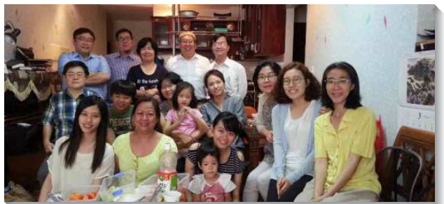
▲在越南的聖徒們相調

主聽了我們的禱告，第二年我們除了配搭服事青職聖徒，也進到兒童服事。我們開始建立兒童排，翻譯兒童教材，兩年中也陸續送十幾個家到海外參加神人生活家庭的訓練，這些家後來就成為全越南兒童工作最主要配搭的家。藉著不定期的召聚兒童服事者的交通，每年全越南或分區舉辦的神人生活家庭訓練，讓受過訓練的家成為施訓者和輔訓，幫助在越南各地建立一個個愛主的家。有次我和一位華語弟兄配搭服事訓練，我們租借外地餐廳，因當時越南正值排華運動，第一堂聚會中那位弟兄就被抓走，弟兄們連夜送我回胡志明市。當我一個